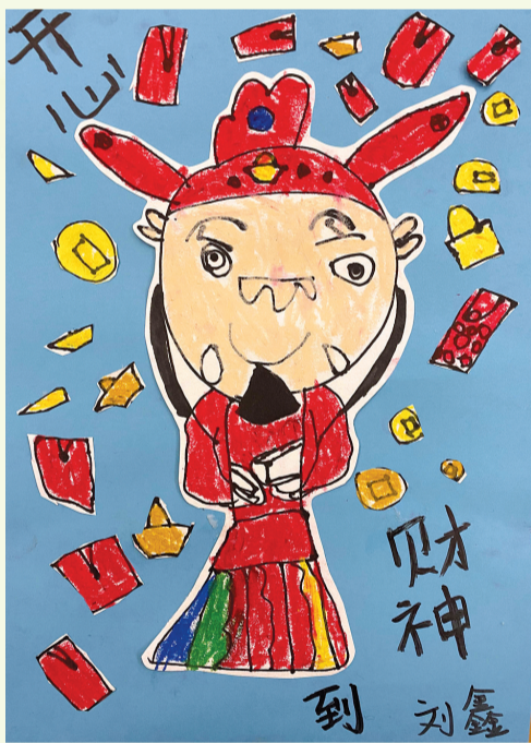
财神到 开化一幼中二班 刘鑫 指导老师 郑莉丽