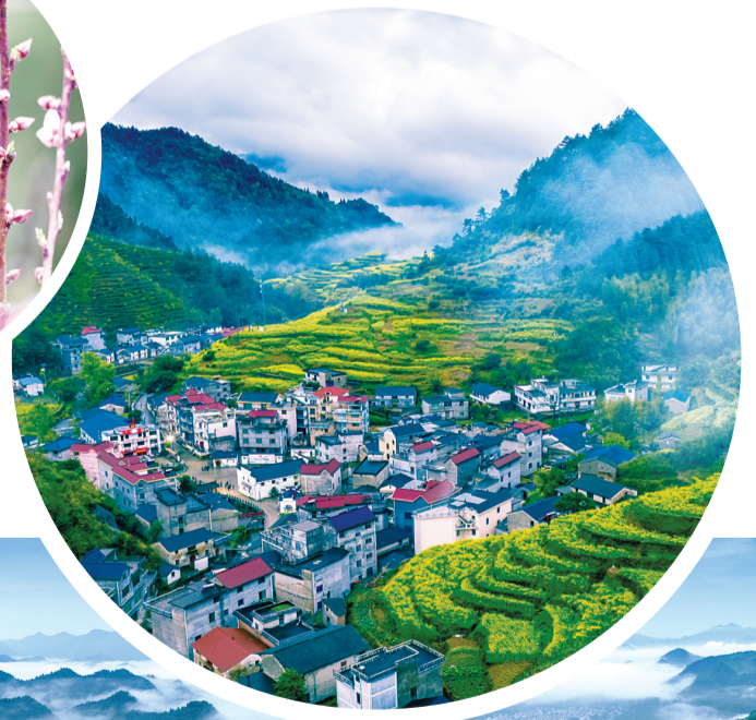
绿水青山就是金山银山