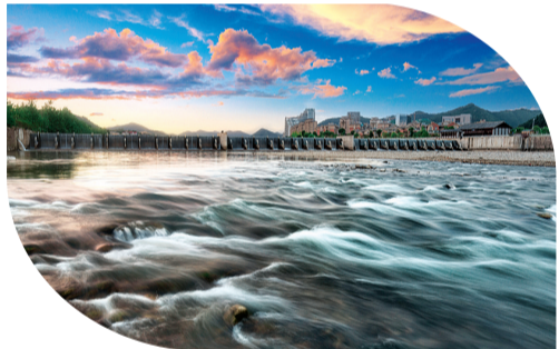
四坝新颜