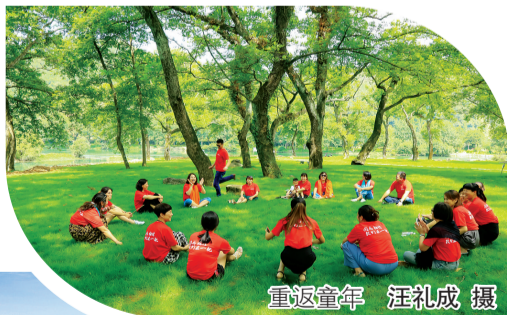
重返童年