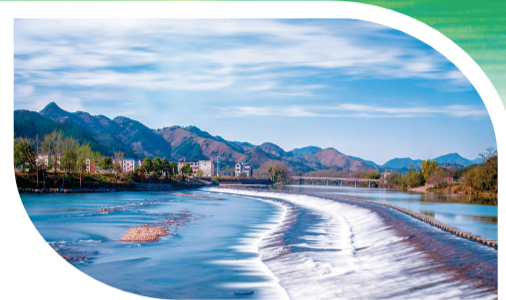
金溪水韵