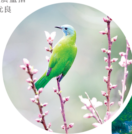
橙腹叶鹎