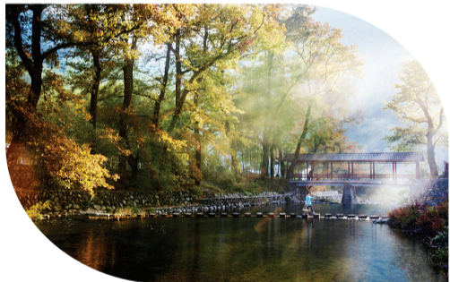
横中枫情