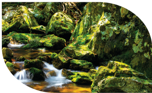
空逐春泉出幽沟