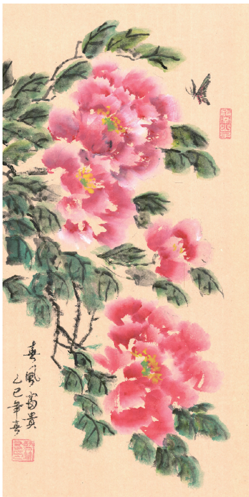
《春风富贵》66cm×33cm 90岁时创作