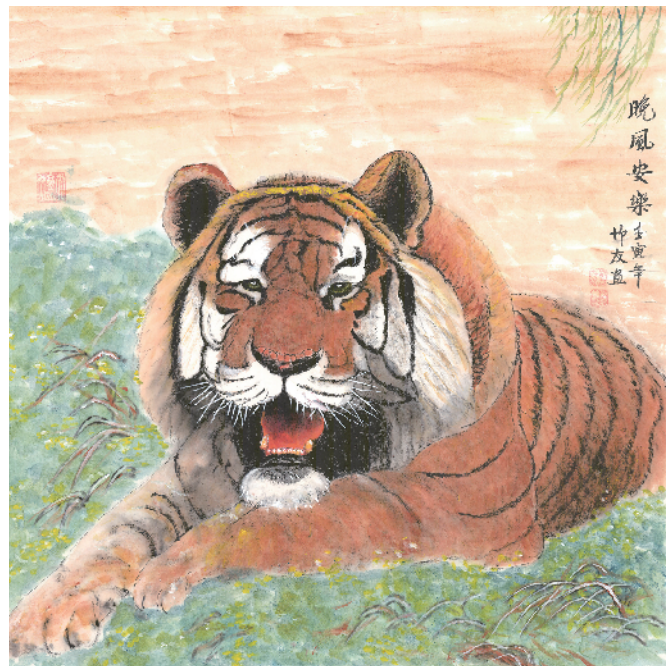
《晚风安乐》69cm×69cm 87岁时创作