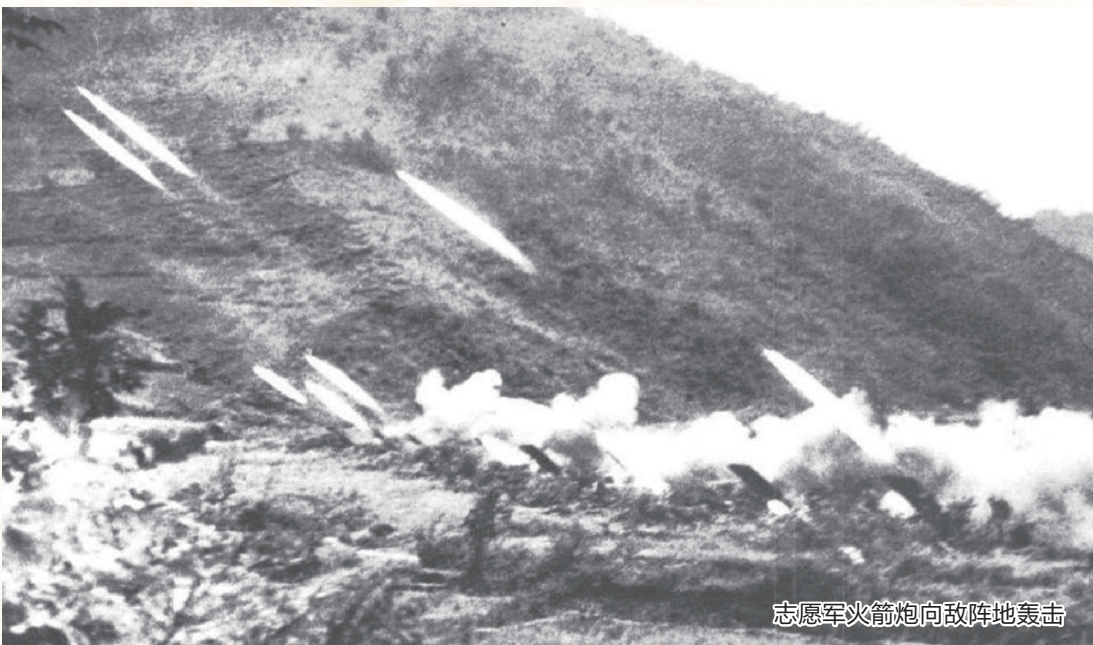
志愿军火箭炮向敌阵地轰击