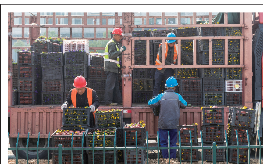
为了增添城区公共绿地底层绿化面积，提高城市底层绿化的通透性、丰富性、立体性、自然性，近期，衢江区实施了市区道路绿化护边项目。截至目前，我区已完成江城大道、霞飞路、东迹大道等周边零星地块底层绿化改造32000平方米、灌木更换约3万平方米、城市道路护边行动约8公里。图为信安中路底层绿化改造正在推进。