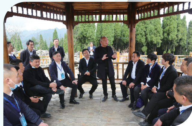
常山县达塘村参观学习