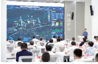
衢江区城市综合管理服务平台展示

制作执法规范化实务操作手册,同步梳理9个方面27项轻微违法不予处罚事项场景清单和51项综合查一次检查场景清单,对执法流程进一步细化和规范。同时,开展“双月督查”,对乡镇和部门的执法案件定期督查,在9个赋权乡镇推行“流动红旗”评比制度,通过定期晾晒,营造比学赶超的氛围。