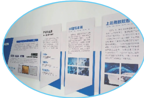
东南数字经济发展研究院衢江分院