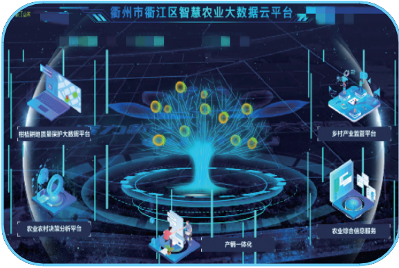
衢江区智慧农业大数据云平台展示

同时,衢江区建成省级高性能纸及纤维复合新材料产业创新服务综合体,成立东南数字经济发展研究院衢江分院,助力全市首家5G智能工厂建设,创成市以上人才平台47个。