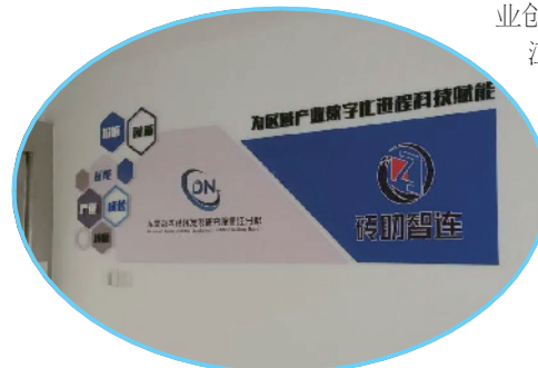
企业“砖助智连”获评省数字经济“新制造”优秀案例