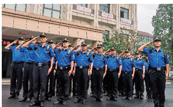
打造高素质执法铁军

推行派驻干部“区属乡用”、执法人员“人模进岗”。将区综合执法、资规、市场监管、司法等4个部门214名执法力量下沉至9个赋权乡镇,下沉比例74.56%,其中45周岁以下占78%,持证人数比例占85%,确保执法力量年轻化、专业化。同时,加强乡镇对派驻干部的统筹管理,将下沉干部全部纳入乡镇“四维考评”,实行单列考核,努力打造一支正规化、专业化的执法铁军。