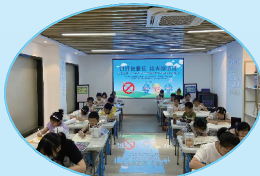
“迎绿色亚运 绘无烟衢江”现场绘画比赛