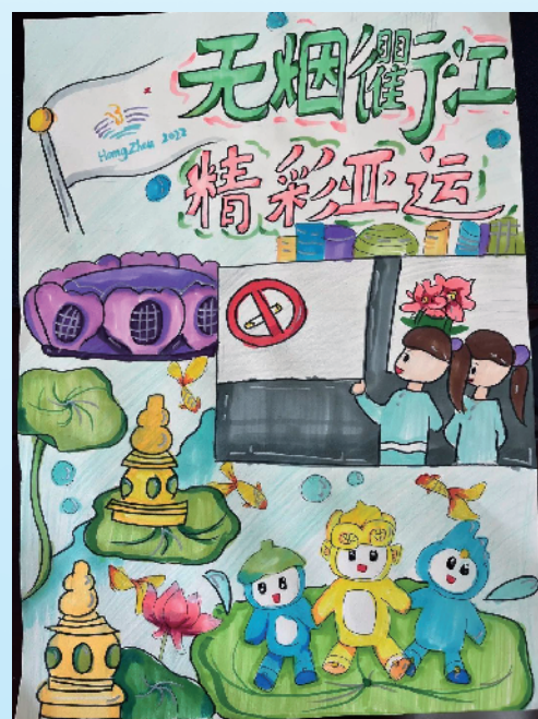
“迎绿色亚运 绘无烟衢江”现场绘画比赛作品