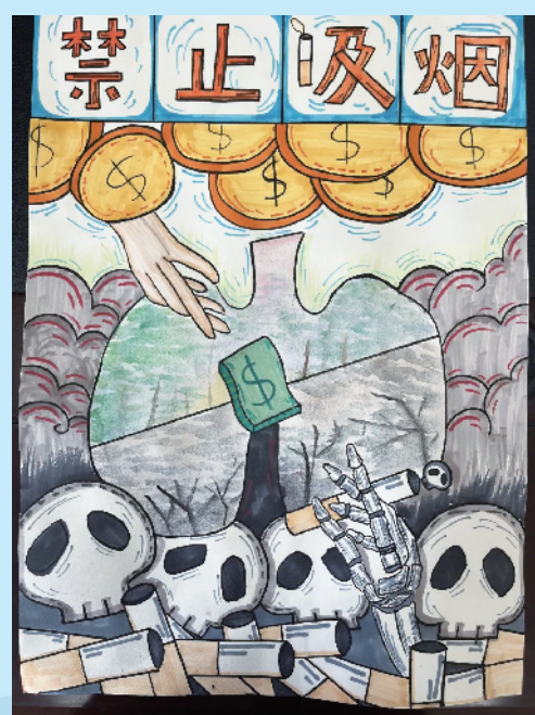
“迎绿色亚运 绘无烟衢江”现场绘画比赛作品

下一步,我区将持续开展“清洁环境 扮靓家园”“礼赞爱卫 弘扬新风”“卫生健康文明同行”等系列主题活动,在横路办事处贺邵溪村、高家镇盈川村、莲花镇西山下村开展爱卫网红打卡点系列宣传活动,广泛持续开展爱国卫生运动,全面提升城乡环境卫生水平,大力倡导文明健康绿色环保生活方式,引导群众筑牢“每个人是自己健康第一责任人”的健康理念,营造人人参与爱国卫生运动的浓厚氛围。