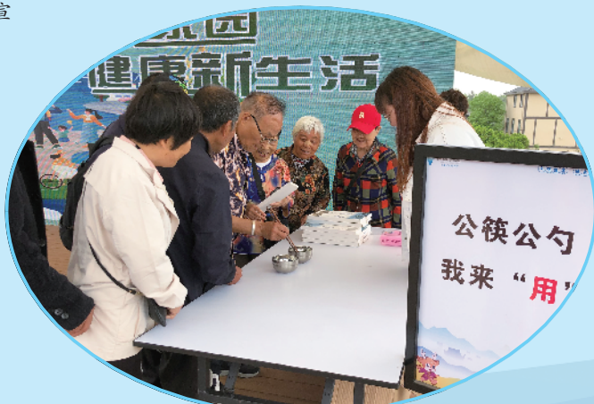
区爱卫办、区卫健局在高家镇盈川村开展第35个爱国卫生月主题宣传活动