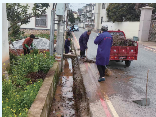
莲花镇干部群众开展沟渠清理

我区还充分发挥医疗卫生机构健康教育主力军作用,在原区级健康科普专家库基础上,分库组建、调整扩充专家队伍,开展健康科普进家庭、进社区、进学校、进单位、进医院等五进活动,重点宣教疫苗接种、适量运动、合理膳食等健康科普知识,提升群众健康知识水平和个人防护技能。