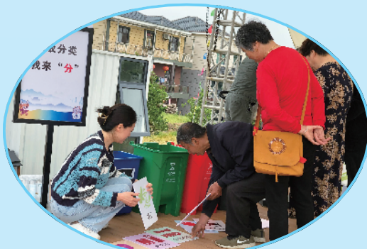
区爱卫办、区卫健局在高家镇盈川村开展第35个爱国卫生月主题宣传活动

和蝇类等病媒生物孳生,形成群防群控、促进健康的工作格局。组织四害专业消杀公司重点对垃圾桶周边、公厕、下水道等孳生地集中消杀,完善重点行业和单位防蚊蝇设施和防鼠设施,维护良好的公共卫生环境。5月25日—26日,我区顺利通过省病媒生物控制水平评估组综合评估,城区鼠、蚊、蝇、蟑螂等四害密度均达到国家标准C级以上。