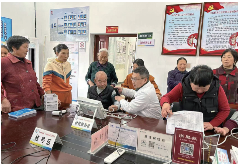
等实际情况,峡川镇卫生院健康服务团队,对偏远山区开启常态化特