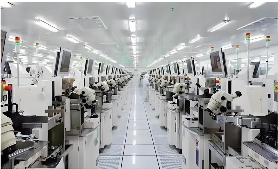
年产10亿颗芯片封测、1000万片激光显示屏和2000万片柔性显示屏项目