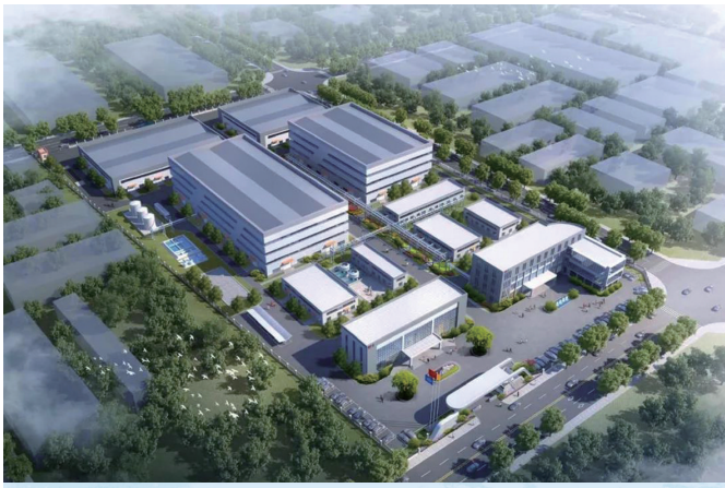
年产15万吨高端无机精细化学品项目