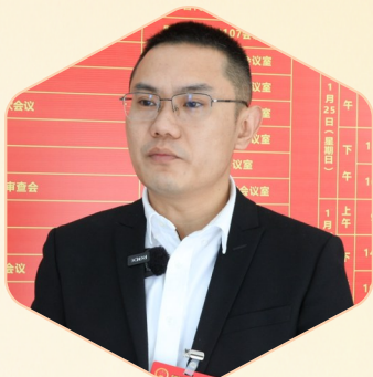
区人大代表、大洲镇镇长 汪璐彬