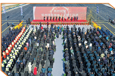
通车仪式现场。

导报讯 1月1日，浙江首条建成即是自由流收费的跨省高速公路——杭州湾大桥北接线二期工程通车运行。