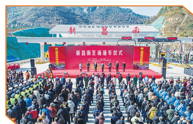
通车仪式现场。□郑怡萱/摄