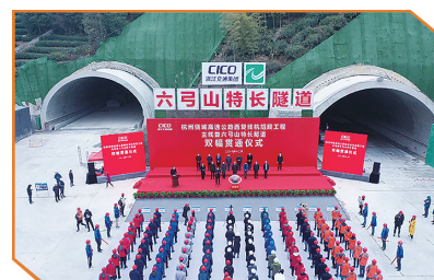
贯通仪式现场。