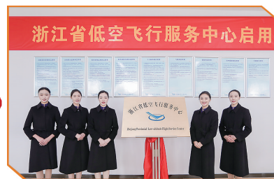
浙江省低空飞行服务中心启用现场。