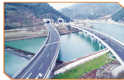
G527宁海桥头胡至深甽段改建工程一景。