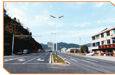
S326(60省道)三门段改建工程一景。