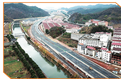
03省道义乌段改建工程一景。□吴燕妮/摄