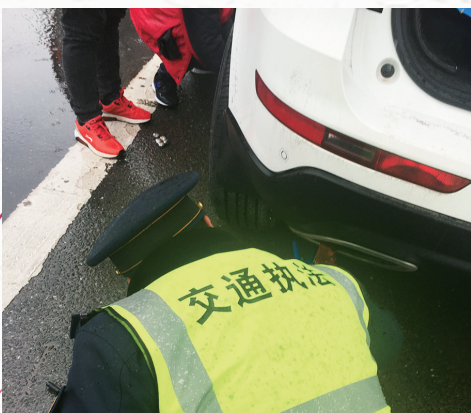
1月10日下午,杭州绕城高速近转塘出口,一辆车子发生爆胎。正在现场的杭州高速路政二大队路政队员迅速前往帮忙换胎。 □李云福 崔义刚