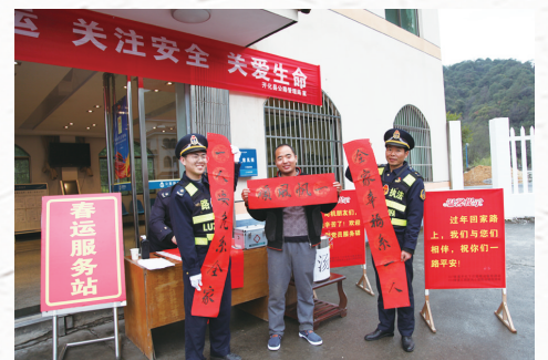
1月10日上午,在351国道开化下庄“春运服务站”,路政人员为返乡民工和过往司机免费提供热水、方便面、姜汤、手写春联、行车指南等服务。 □徐曙光 黄娟 陈保罗