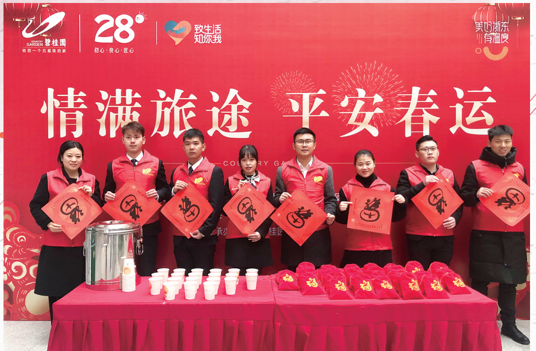
1月10日,台州市道路运输管理局“情满旅途平安春运”2020春运启动仪式在台州客运总站广场举行。 □张诗雨 徐一宁