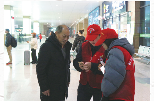
台州公交集团巴士公司志愿服务站的“小红帽”们在黄岩综合客运枢纽站为旅客帮忙。 □张诗雨 李勇箭