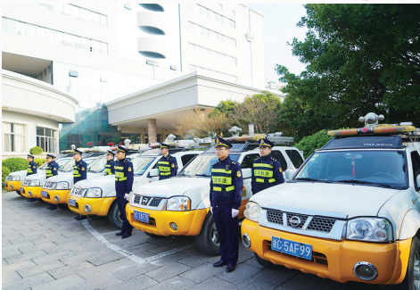
1月9日,温州市本级交通运输市场专项整治“春雷”行动启动。 □冯军 周晓辉 胡炜 李叶 沙凯迪