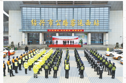
1月10日上午,绍兴市公安、交通2020年春运暨联合执法行动启动仪式在绍兴客运西站正式启动。 □黄俊 钟海杰