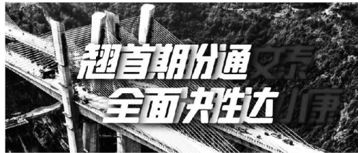
10月31日，文泰高速桥头进口路段机声轰鸣，运料车有序进出，摊铺机有序运转，压路机梯队跟进。随着最后一车沥青拌合料摊铺、碾压完毕，文泰高速全线沥青路面实现双幅贯通，标志着全长56公里的文泰高速路面工程全部完成，项目进入年底通车倒计时阶段。