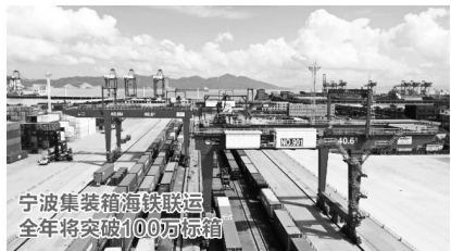
宁波集装箱海铁联运 全年将突破100万标箱