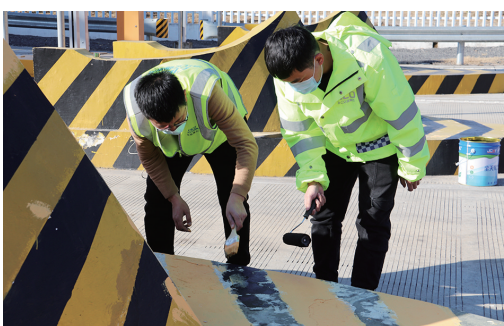
龙泉 ▲近日,浙江交通集团龙浦收费中心所组织人员对辖区内收费站的安全岛和收费岗亭进行了重新刷漆。旨在进一步美化路域环境,提升收费站的美观度,提高司乘人员的视觉体验。