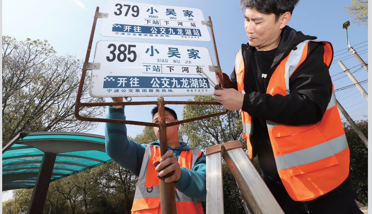
宁波 ▲日前,宁波公交集团镇海公司候车亭维修班组对管辖范围内近600个公交候车亭进行了一次全方位“体检”,对玻璃破损、广告纸脱落、候车凳损坏、牛皮癣等情况进行集中维修和清理。此次“体检”重点加强镇海景区周边候车亭的隐患排查和清洁力度,进一步营造干净整洁、安全舒适、文明有序的乘车环境,保障市民出行安全。