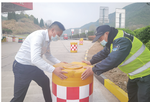
天台 ▲日前,浙江交通集团天台服务区全面开展路域安全专项治理行动,在南区入口用注水防撞桶设置一道50米长的安全防线,以杜绝路域安全隐患,确保服务区安全再升级。 □应先云/摄影报道