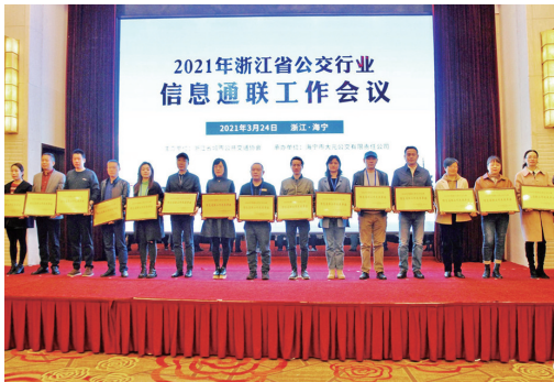
景宁 ▲日前,2021年浙江省公交行业信息通联工作会议工作表彰大会在海宁市召开。景宁畲族自治县公共交通有限公司获评“2020年浙江省公交行业信息通联工作先进单位”。