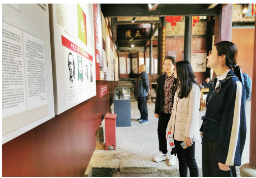
开化 ▲近日,开化县公路港航与运输管理中心组织全体党员开展了一场主题党日活动。图为党员们在该县齐溪镇龙门村中国工农红军北上抗日先遣队纪念馆参观学习。 □徐曙光/摄影报道