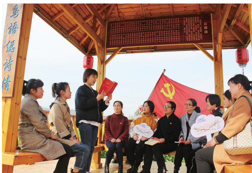
温州 ▲近日,浙江交通集团温州管理中心组织党员走进永嘉县卢湾村的“耕读亭”,学习习近平总书记在党史学习教育动员大会上的重要讲话精神。