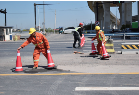
工作人员正在设置防撞桶。

为确保此次导改工作安全平稳有序完成,项目部精心筹备部署,编制了交通导改工作实施方案以及后期维护方案。施工过程中,导改小组成员严格按照分工做好铁马、防撞桶、弹力柱、标志标牌的设置工作,并通过对讲机进行及时沟通,集中力量有序进行导改。“此次交通导改工作在确保主线交通不断流的情况下,