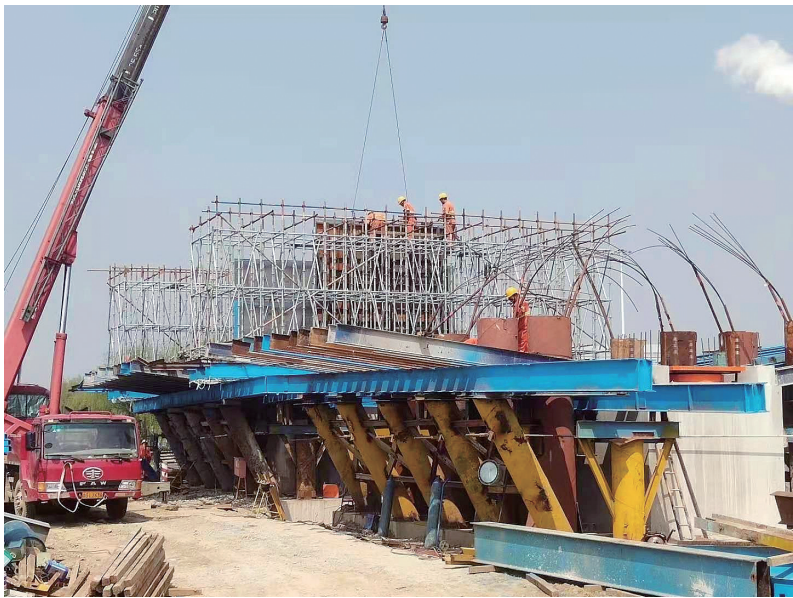
施工现场。