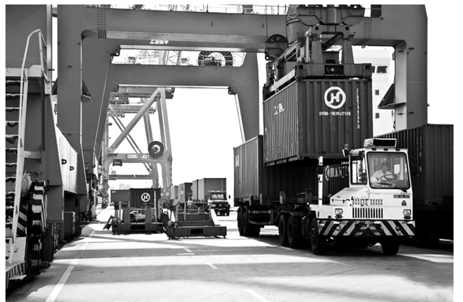
嘉兴港乍浦港区一景。

导报讯近日，嘉兴港5个新泊位运营已“满月”。据码头经营单位统计，一个月来，累计靠泊国际航行船舶13艘，进口对二甲苯、铜精矿、煤炭等货物16.2万吨，实现开门红。