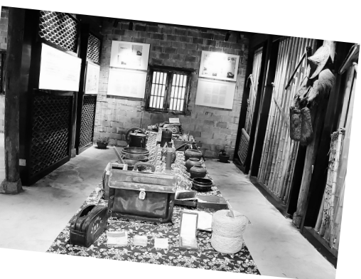
“天路”馆陈列的一件件展品,无声地述说着历史