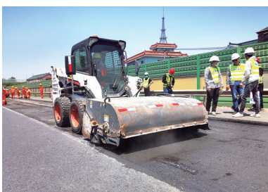
施工现场。