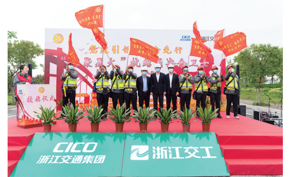
活动现场。