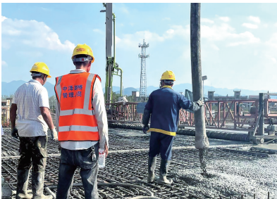
施工现场。

导报讯 国庆假期期间，临安至苍南公路佛堂互通至上佛路段工程建设者防疫、保安全、抓生产，为了项目“高效建造、完美履约”辛勤付出着。