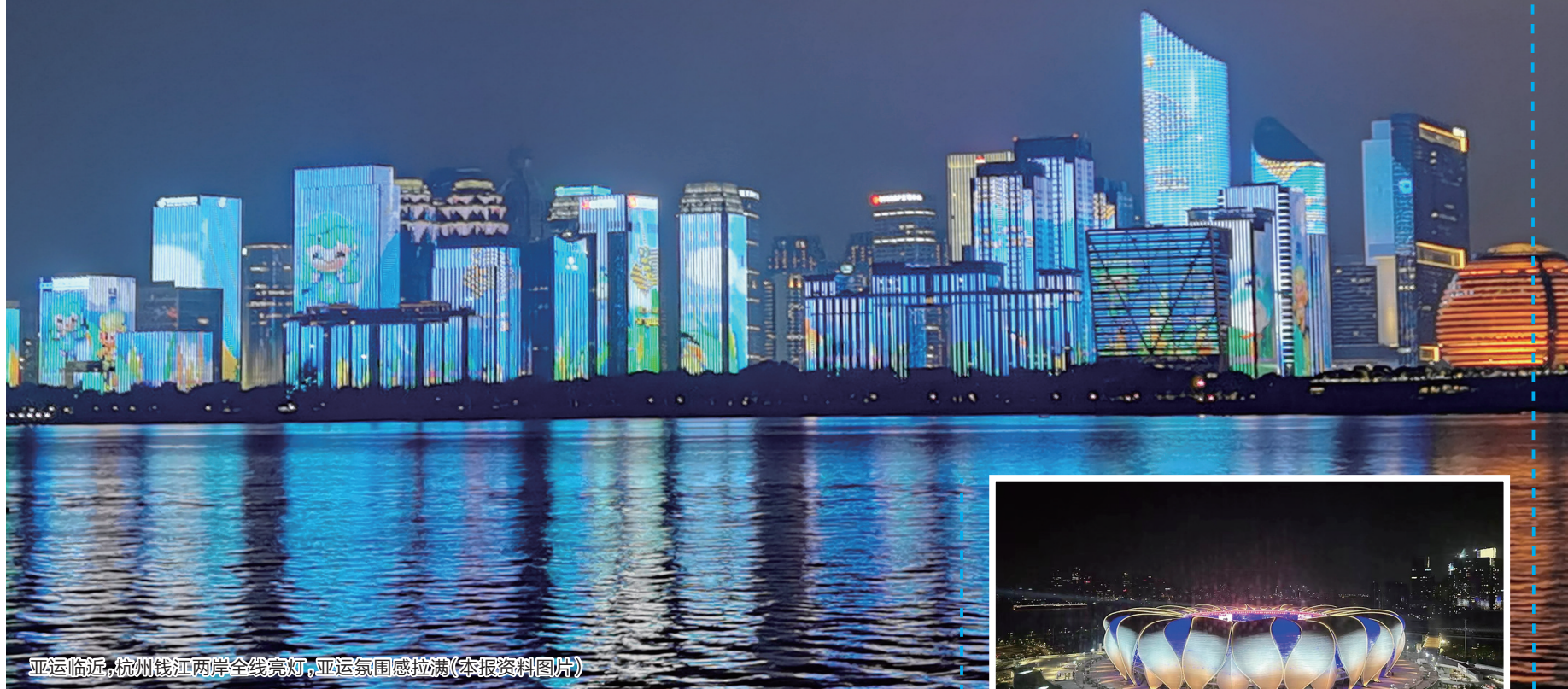
亚运临近,杭州钱江两岸全线亮灯,亚运氛围感拉满