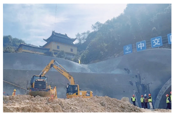
施工现场。

导报讯 2月19日,在甬台温改扩建工程台州南段TJ03标施工现场,工人们各司其职,作业有条不紊,全力奋战一季度“开门红”。 据悉,为全力保障项目施工进度,春节期间,该工程项目部制定了“两重不停”施工方案,明确各标段生产任务及计划,并提前对年后各项工作进行安排,假期结束后便立即组织项目有序复工复产。截至目前,该工程全线6个在建标段已全面复工,近400名一线建设者铆足干劲,高效推进项目建设。 管理人员已到岗25人,施工人员进场31人,挖掘机、桩机、铲车等施工设备已进驻现场……当天,在该工程TJ04标施工现场,工人们正紧张有序地进行路面软基处理等工作。为做好复工复产工作,TJ04标项目部“定目标、抓生产、保安全、促质量”,迅速进入工作状态,组织一线管理人员对项目各项工作制定详细计划,保障项目建设有序推进。同时,项目部还积极做好安全宣传、安全检查、隐患排查等措施,保证项目施工安全工作有序进行,做到早发现、早处理、早解决,力争保质保量完成阶段性施工任务。 “我们标段各个作业点已全面复工,共有管理人员35人、工人60人到岗,接下来人员还会不断增加。”该工程TJ01标项目部相关负责人介绍,目前施工现场的安全生产条件核查已全部完成,各施工点位已全面进入建设阶段。 同样,在该工程TJ05标项目部,26位管理人员已全部到岗,班组工人也陆续返岗,大家迅速恢复到工作状态。TJ06标也已全面复工,项目管理人员对复工复产的安全状况进行了细致检查,为项目建设保驾护航。 台州交投高速公路有限公司董事长郭伶表示,春节假期结束后,甬台温改扩建工程台州南段项目建设者积极投入到新一年的奋斗中,以全年完成投资35亿元为目标,力争工程建设取得新作为,工程质量达到新水准,全力以赴为项目全年建设开好局、起好步。 □通讯员 毛琼莺 尤丹琪