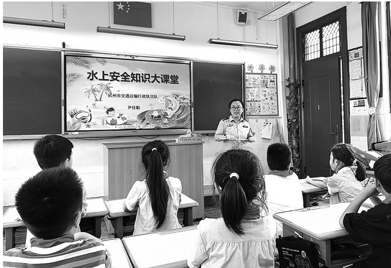
安全知识宣讲。