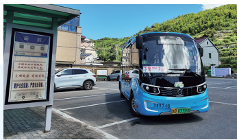
●客货邮车驶入小山村

公交服务同样实现质的飞跃。2021年以来,上虞新建公交候车亭273个、无障碍设施50处,优化公交线路108条,较大自然村公交通达率达98%,城乡公交一体化率提升至96%。“赏花专线”“十三弄文旅专线”等特色线路,让“公交开到景点门口”。同时,上虞推动交通物流“降本增效”,建成区级供配中心1个、乡