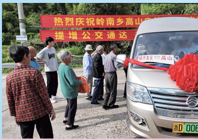
●岭南乡高山自然村通公交

批土地指标2609亩;104国道南移、329国道北移获“两重”国债资金14.8亿元,有力缓解资金压力。目前,虞北基础设施提升工程形象进度达89%,104国道东蒿线进度完成60.5%,将在未来两年建成通车。