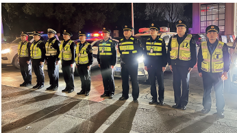
●开展“惊雷”联合执法行动

安全治理与暖心服务并重。全省首个危化品运输车辆停车场高标准建成,有效解决乱停、乱洗、乱修等难题。交通运输部门积极回应司机诉求,推动停车场24小时费用下降50%,优化共享单车点位,完善休息区设施,既守牢安全底线,又传递城市温度。