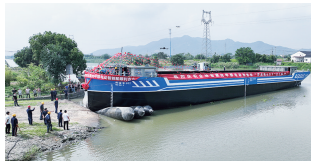
●全球首台套纯甲醇电动智能船舶“舜通集601”成功下水

上虞坚持以改革创新破解发展难题,以智慧赋能提升治理效能。公路领域,农村公路灾毁保险入选省交通强国试点;农路与森林防火巡护道共建模式在全省推广。水路领域,“曹娥江上虞段智慧航道项目”获中国航海学会科技进步二等奖;内河船舶自主航行及绿色智能航线项目初步入选交通强国首批试点。