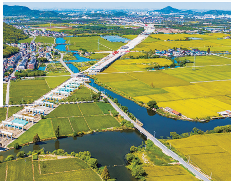
●建设中的104国道绍兴东湖至蒿坝段改建工程(上虞段)