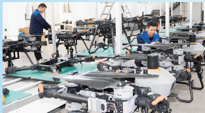
●中测航空科技(浙江)有限公司生产车间内,技术人员正加紧组装低空运输无人机

当无人机掠过盖北葡萄园,当直升机载客俯瞰岭南山水,当农业无人机在田间精准作业——上虞正以“天空视角”重塑发展格局。