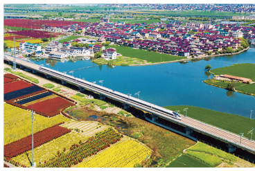
●杭台高铁,列车飞驰

要素保障是项目落地的关键。面对土地、资金等难题,上虞交通人迎难而上,啃下“硬骨头”。S307、S306等8个重大项目通过“三区三线”调整释放稳定耕地4969亩;虞北基础设施提升等项目累计获