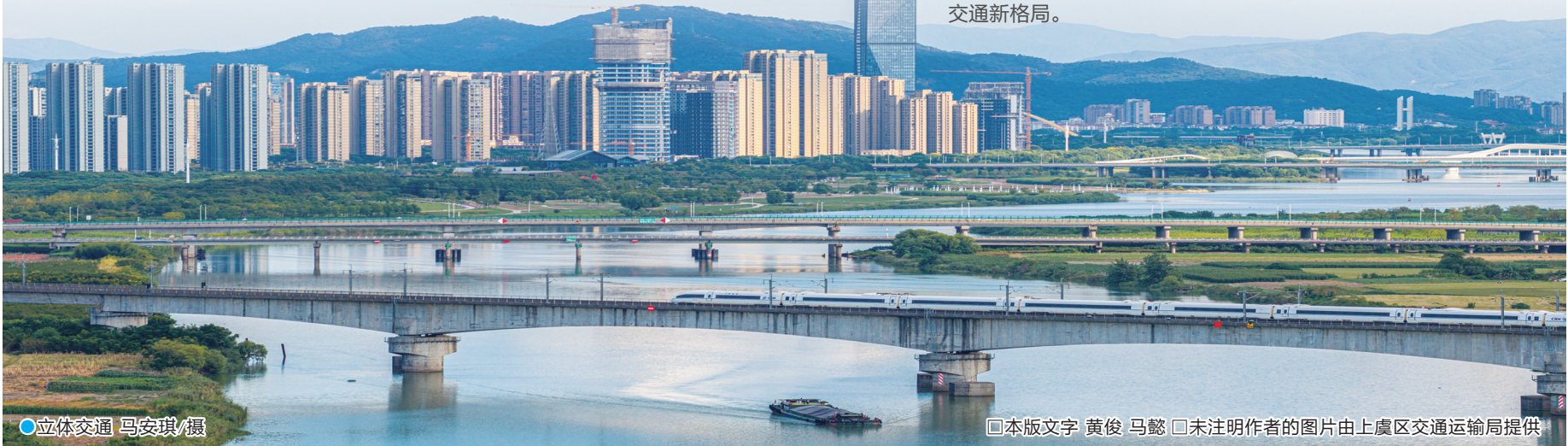
●立体交通

回首“十四五”,上虞交通以实干交出了高分答卷。展望“十五五”,上虞将以建设网络大城市、打造共同富裕地为引领,锚定“融杭联甬接沪交通先行区”目标,加快构建安全韧性、便捷高效、绿色经济、包容共富的现代综合立体交通新格局。