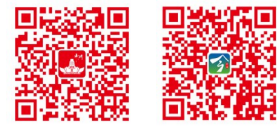
平湖发布 今平湖客户端