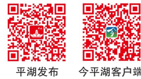
平湖发布 今平湖客户端