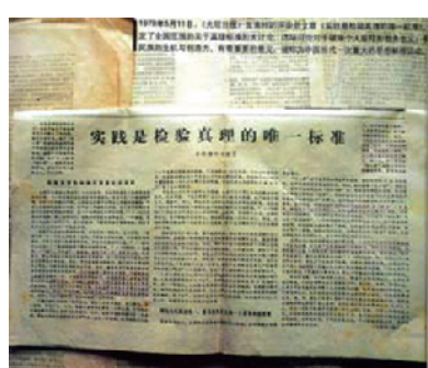
报纸刊载的《实践是检验真理的唯一标准》

粉碎“四人帮”后的头两年, 人们头脑中“左”的思想禁锢仍然存在, 其主要表现就是受到“两个凡是”(凡是毛主席作出的决策, 我们都坚决维护; 凡是毛主席的指示, 我们都始终不渝地遵循)的束缚。“两个凡是”成为全党纠正“文化大革命”“左”的错误和拨乱反正的主要障碍。1978年5月11日, 《光明日报》发表特约评论员文章《实践是检验真理的唯一标准》。文章论述了马克思列宁主义的实践第一观点, 指出任何理论都要接受实践的考验, 马克思主义的理论并不是一堆僵死不变的教条, 要在实践中不断增加新的内容, 对“四人帮”设置的禁锢人们思想的禁区, 要敢于触及, 弄清是非。5月12日, 《人民日报》等报纸全文转载这篇文章, 由此掀起全国性的真理标准问题大讨论。