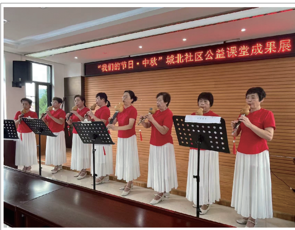
“我们的节日·中秋”城北社区公益课堂成果展

会议强调,要规范定兵公示工作,着重把握公示方式方法,自觉接受社会和群众的监督。要做好入伍青年复查复审,严格落实“谁审查、谁签字、谁负责”责任制,继续加大对已定兵员的复查复审力度和节奏,确保兵员质量。要认真组织好役前训练,全时做好思想工作,为新兵迈好军营第一步打好基础。要严密组织“从戎之剑”授剑仪式,为每一名应征入伍的新兵赠送“从戎之剑”,进一步增强入伍新兵的荣誉感,提升军人职业的优越感。要确保新兵交接运输安全,严密制定方案计划,认真搞好风险评估,过细组织运输交接,坚决做到不误一车、不错一地、不漏一兵、不伤一人,确保全程安全顺利。