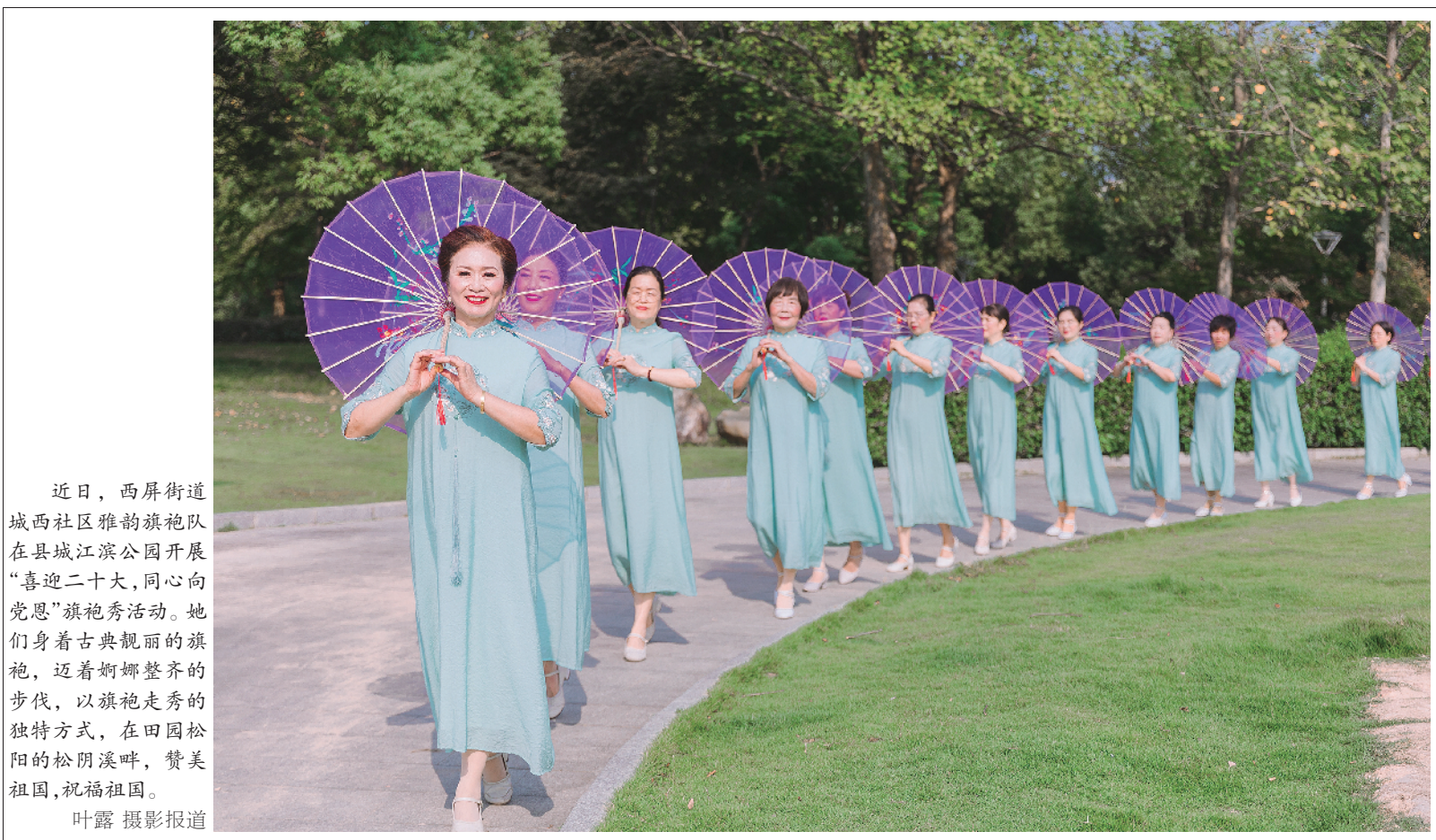
近日,西屏街道城西社区雅韵旗袍队在县城江滨公园开展“喜迎二十大,同心向党”旗袍秀活动。她们身着古典靓丽的旗袍,迈着婀娜整齐的步伐,以旗袍走秀的独特方式,在田园松阳的松阴溪畔,赞美祖国,祝福祖国。

据了解,“四好农村路”大中修工程泉大线路段位于新兴镇泉庄村和大石村之间,途经泉庄、杨村头、后周包、大石等村庄,建设总长度 2.8 公里。沥青摊铺完毕后,路面漆画标线、橡胶减速带等设施将陆续进行施工,预计 10 月上旬全部完工。