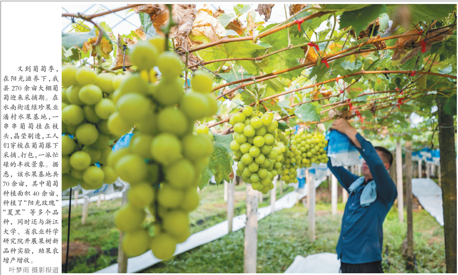
又到葡萄季,在阳光滋养下,我县270余亩大棚葡萄迎来采摘期。在水南街道绿珍果业潘村水果基地,一串串葡萄挂在枝头,晶莹剔透,工人们穿梭在葡萄藤下采摘、打包,一派忙碌的丰收景象。据悉,该水果基地共70余亩,其中葡萄种植面积40余亩,种植了“阳光玫瑰”“夏黑”等多个品种,同时还与浙江大学、省农业科学院开展果树新品种实验,助果农增产增收。

城北社区辖区面积2.89平方公里,有大型集中住宅小区3个,其中封闭式小区2个。该社区聚焦“睦邻城北 多彩生活”特色品牌打造,深化基层治理与社区服务相融合,通过深化网格“自治+智治”,成立“睦邻”志愿服务队、创新“千百万”服务机制等方式形成“共建共治共享”治理合力,着力推进党建引领社区治理体系和治理能力现代化。