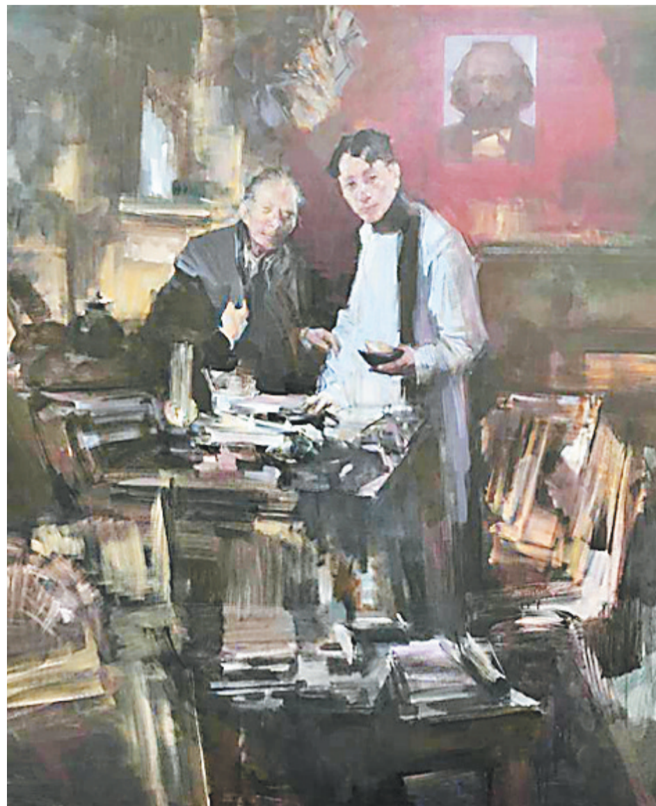
油画《真理的味道》 俞晓夫作