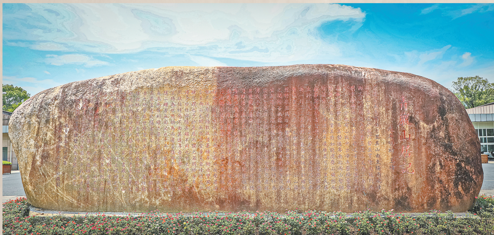
立于义乌中学内的《青岩山居记》石刻,熠熠生辉。