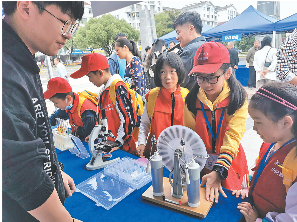
小记者饶有兴致地在科普展台体验科学小实验。

在这金秋送爽、丹桂飘香、喜庆丰收的季节,在全市上下奋力打造“两个样板”、争当“重要窗口”模范生的浪潮中,市科协、市委宣传部、市教育局、市科技局、市水务局、市农业农村局、市卫健局、市应急管理局等部门联合主办,江东街道办事处协办的2020年全国科普日义乌主场活动启动仪式,于9月22日在义乌鸡鸣山公园广场隆重举行。义乌商报小记者团的五位金牌小记者也化身“小小科普家”,前来参加采风采访,为义乌科普宣传代言。