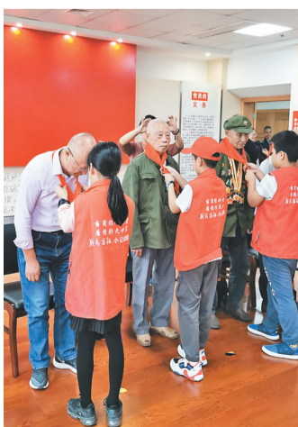
△小记者给老同志系红领巾。