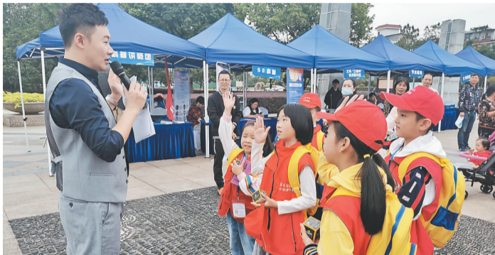
小记者积极参与科普知识互动问答环节。