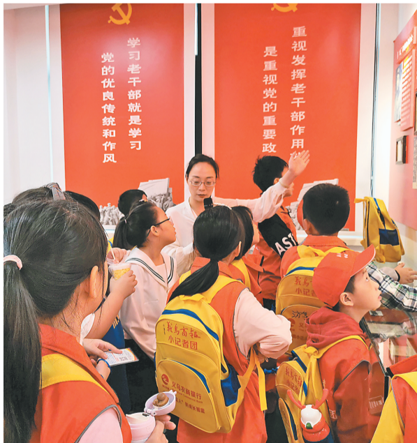
△小记者参观义乌市老干部事迹陈列馆。