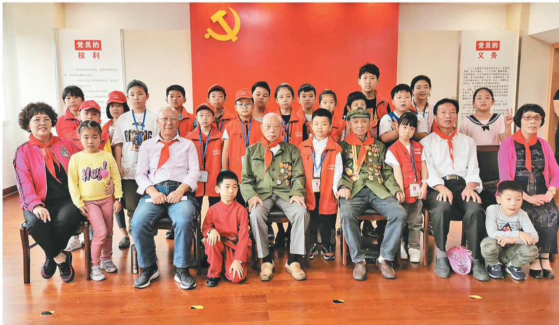
△小记者与老革命老干部老教师一起合影。