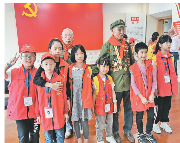
△小记者纷纷与老革命合影。