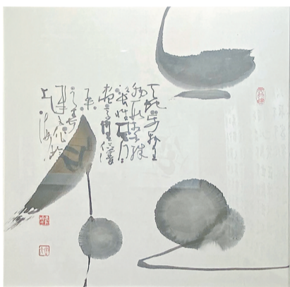
杨建文书《俭》天地万物生,物形相各殊。长风唯风月,尽享无俭谱。