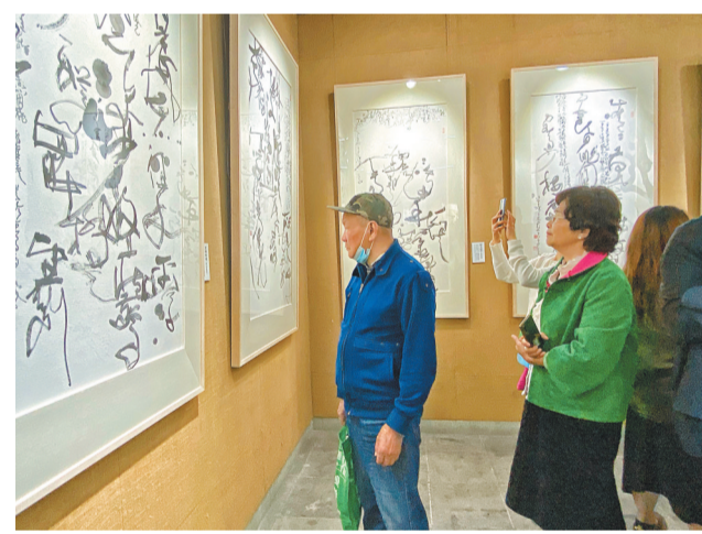
画展内观众络绎不绝。

除了书画合一,杨建文书法中还取意于传统诗词,即“字文一体”。他解释,现代文学言物简洁易懂,但缺乏词性的美感和情感的含蓄,不利于书法表达。因此,杨建文一直坚持传统诗词创作并用于书法作品创作的蓝本。用传统诗词创作并不意味着他守旧复古,而是他赋予了传统诗词现代感和反思精神。用他自己的话说,格律不应成为现代人自由表达的障碍,格律要同步时代文化走向,满足人们审美的新时代要求。他的诗词作品对当代语境的尊重高于诗词的传统,不再拘泥于传统格律的约束,更多展现的是语言的境界。