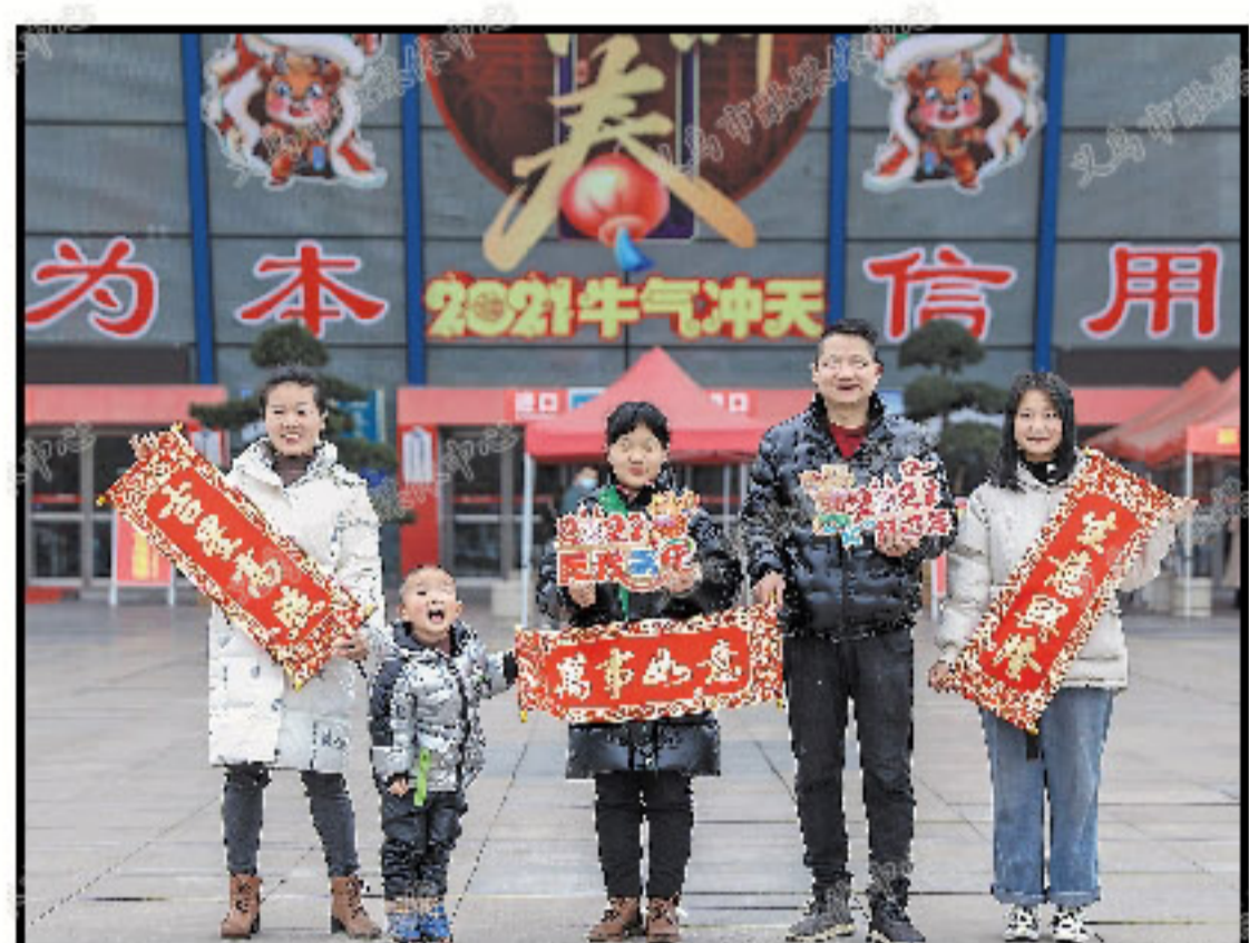
在国际商贸城一区西门,义乌市摄影家协会的摄影师们,为留在义乌过年的新义乌人拍摄全家福。