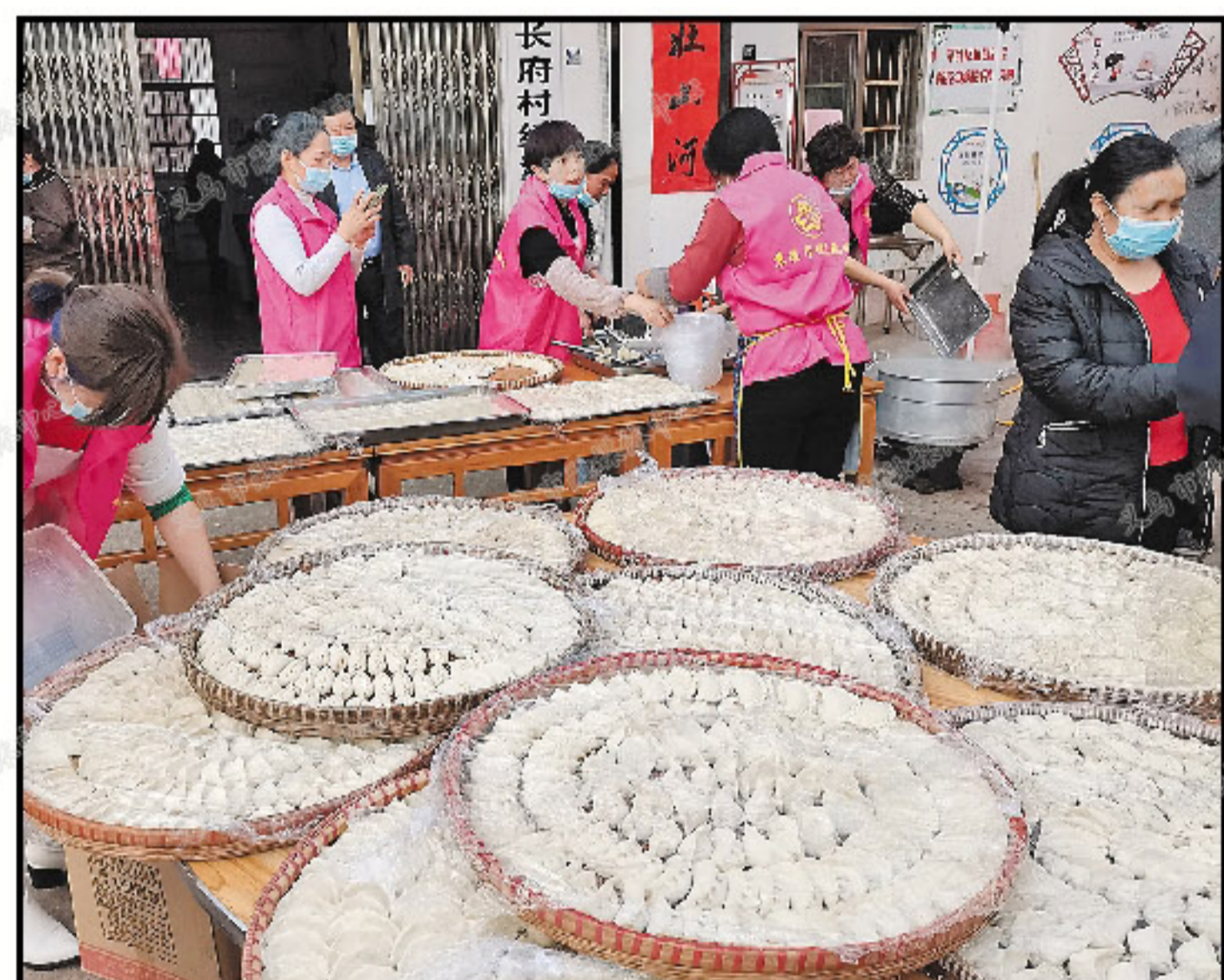
在苏溪镇苏福社区长府小区,20多名巾帼志愿者正为500余名留在本地的外来建设者包饺子,共度新春佳节。

本期撰稿/摄影: 全媒体记者 吕斌 蒋筱兰 摄友 张莹莹 何胜雄 胡友大 任子安 王永亮 本期策划:视觉影像工作室 义乌摄影家协会 未经视觉影像工作室同意,本版图片不得转载、转发;如有侵权,责任自负。