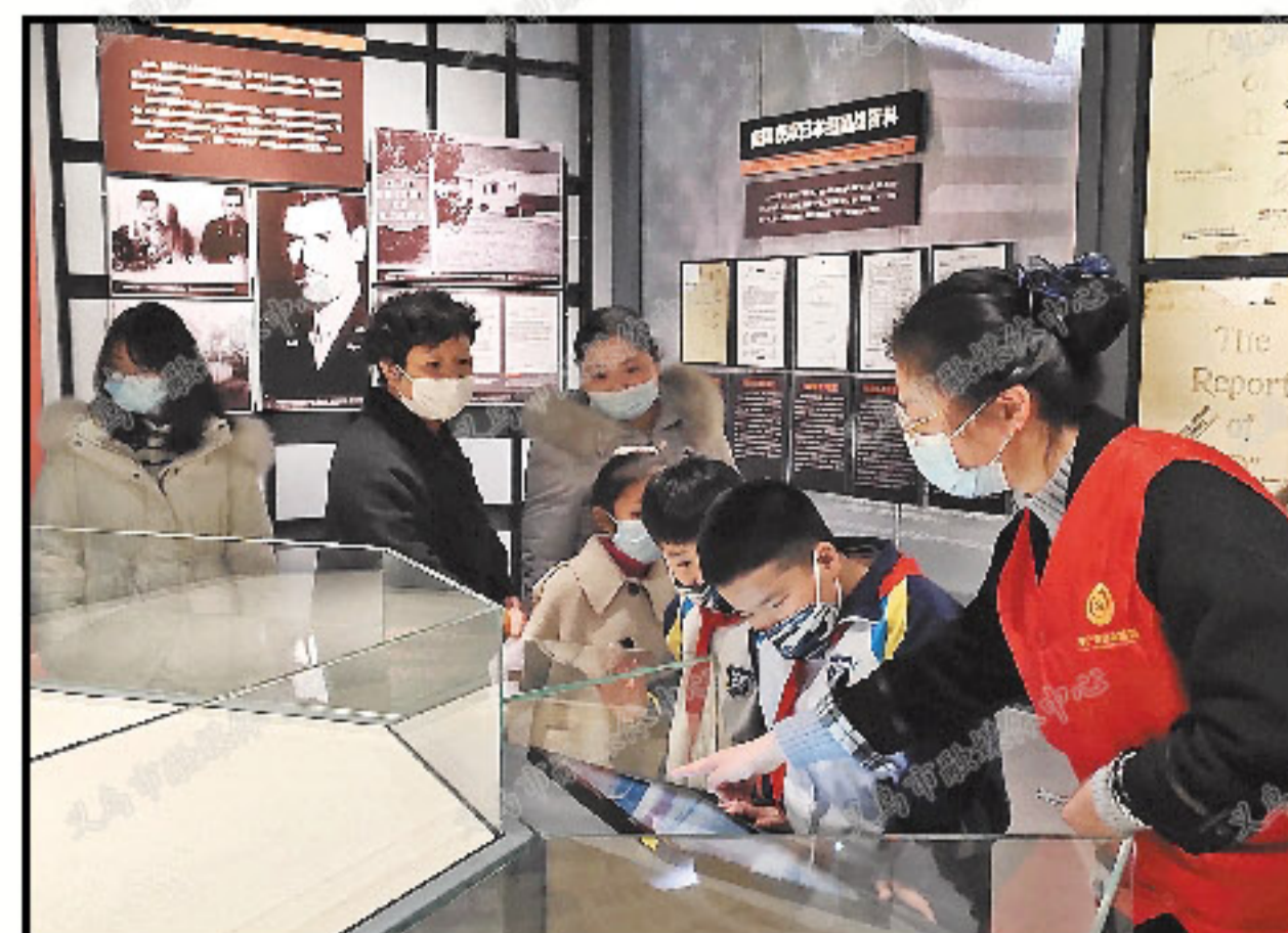
在侵华日军细菌战史实陈列馆,家长和学生通过实地参观,了解史实,丰富假期生活。