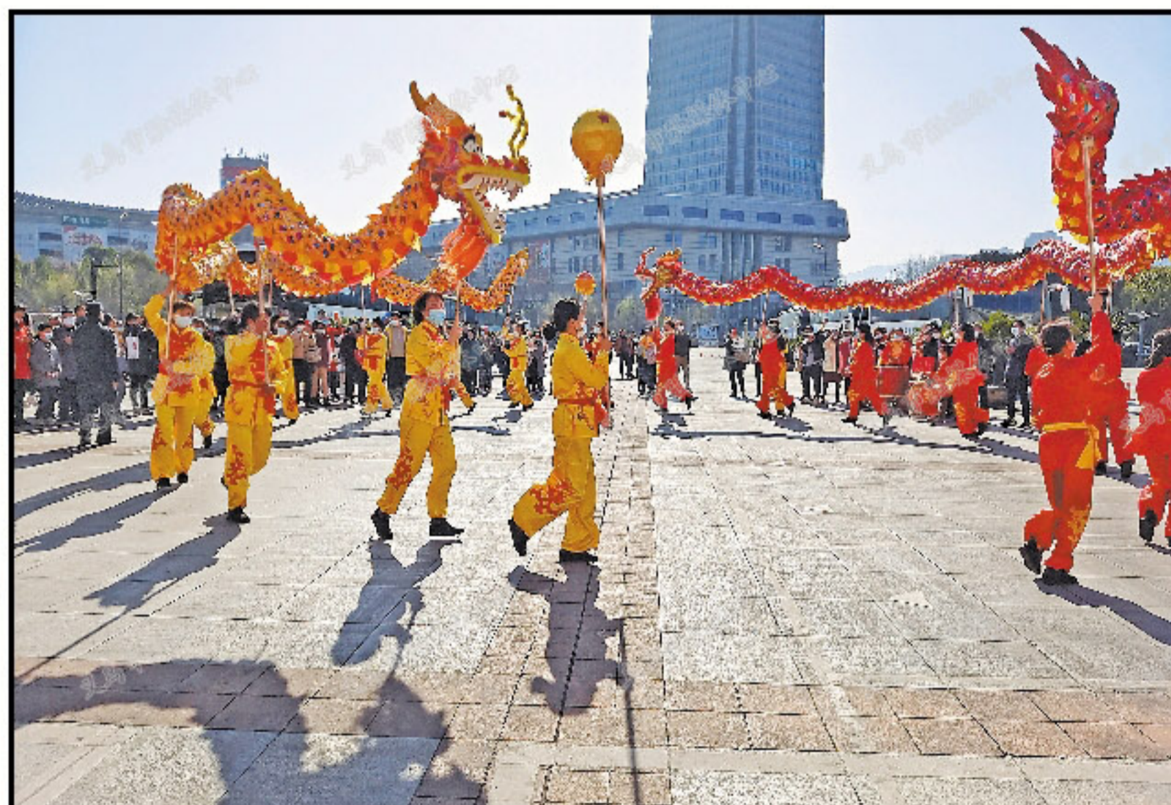
2月20日,农历大年初九,经营户们舞起龙灯,迎接市场开市。