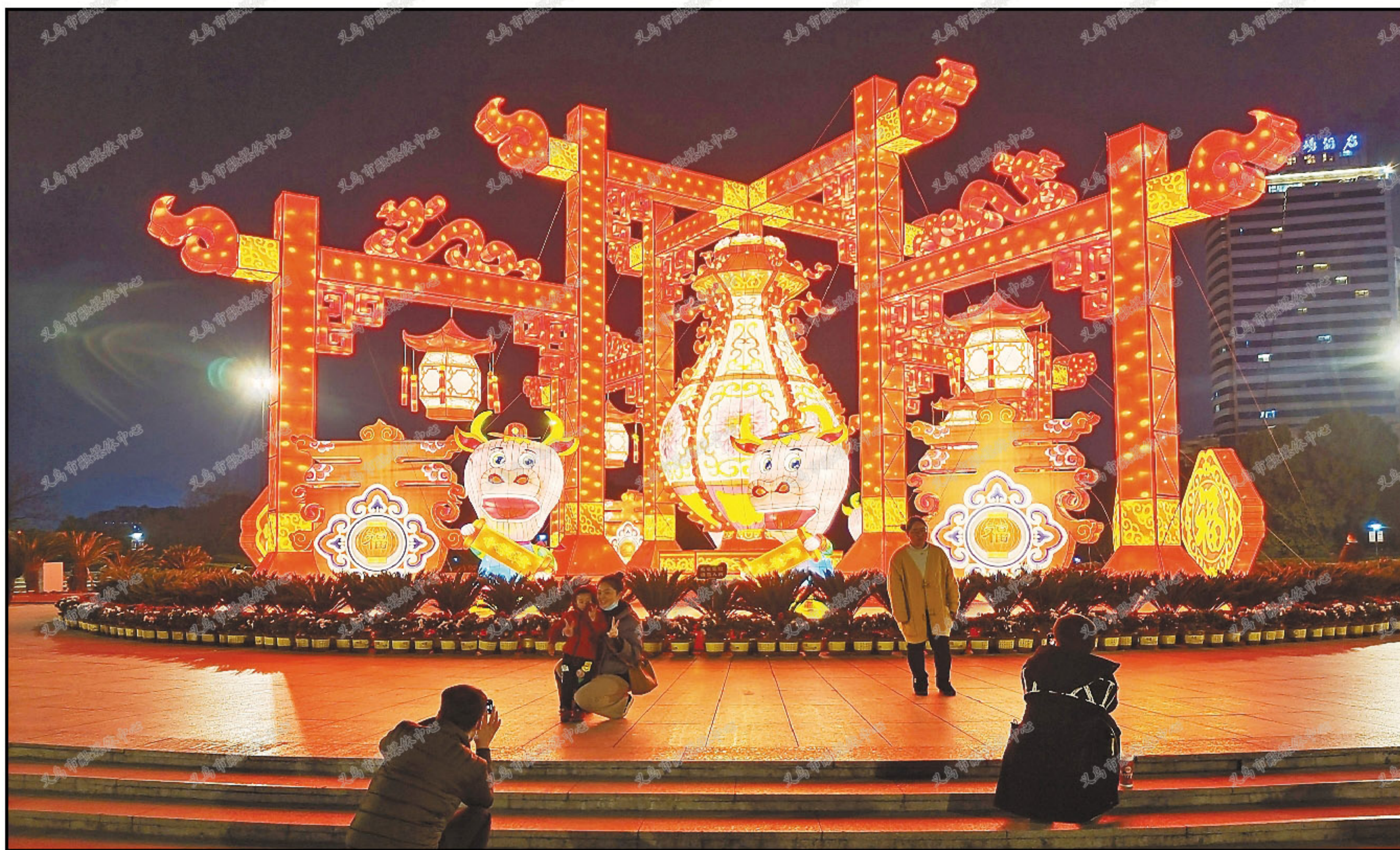
绣湖广场巨型灯展,营造了一派温馨祥和的过年氛围。

今年的牛年春节,对于在这座国际知名商贸城市工作、经商、生活的市民们和新义乌人来说,是一个不同凡响的年,许多人积极响应市委市政府发出的留义过年号召,在义乌度过了一个温暖祥和的春节。