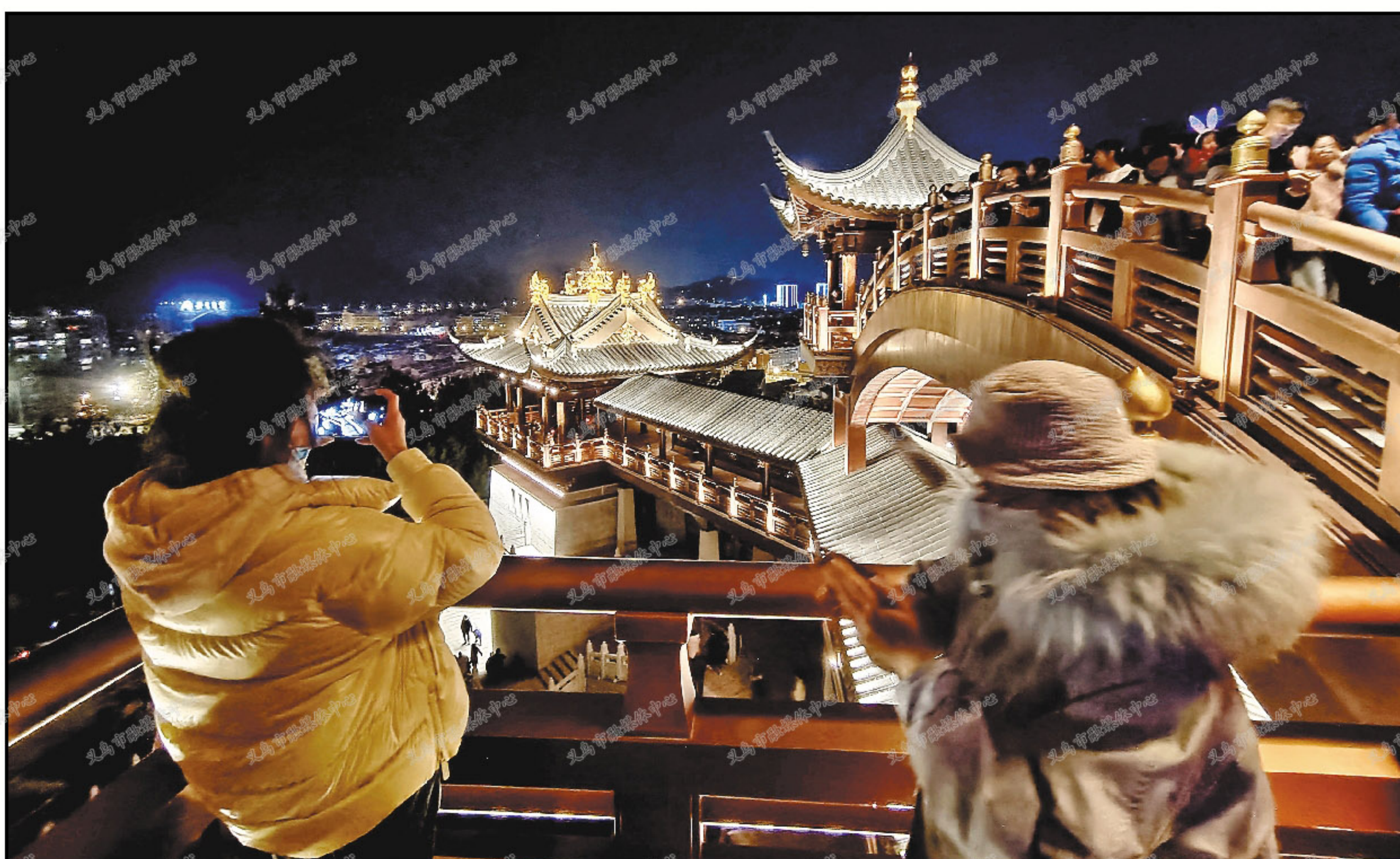
位于市区鸡鸣山的鸡鸣阁,春节期间成为最火的网红打卡地,每天登高游览的市民络绎不绝。