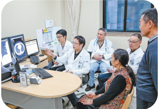
肺结节多学科联合门诊。