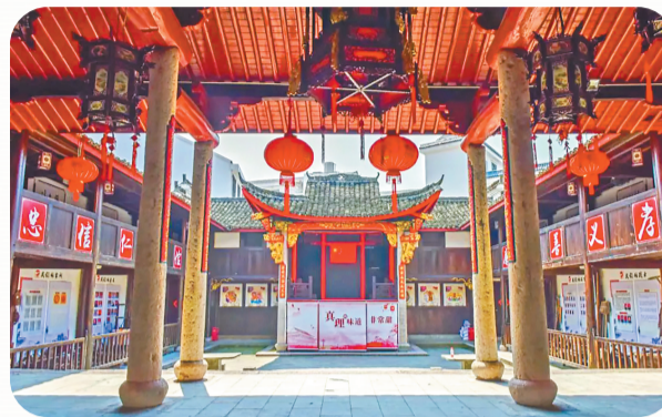
分水塘村文化礼堂。