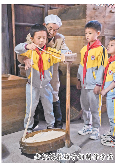
老师傅教孩子们制作索面

据悉,吴店索面不但被评为上溪美食“五朵金花”和义乌十大美食之一,其制作技艺还被列入义乌市非物质文化遗产名录。吴店索面制作体验馆位于上溪镇荷市村文化礼堂内,免费对外开放,感兴趣的市民可前往体验。