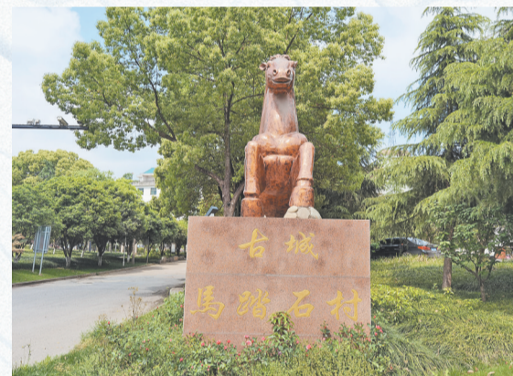
马踏石村的马塑像。