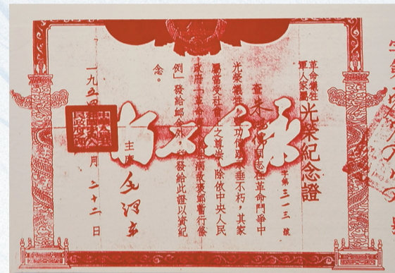
中华人民共和国中央人民政府颁发给烈士家属的《光荣纪念证》。