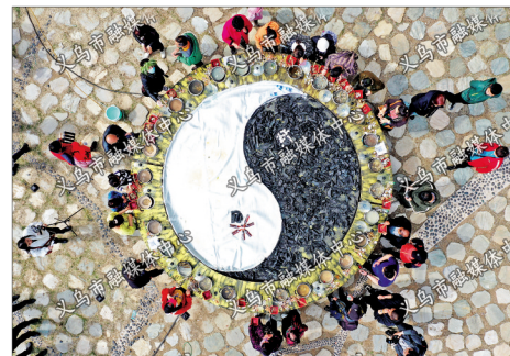
“五一”期间的海鲜盛宴,板厂峪村口架起直径6米的大锅,28个小锅装满鲜美的海鲜,吸引八方游客前来品尝。