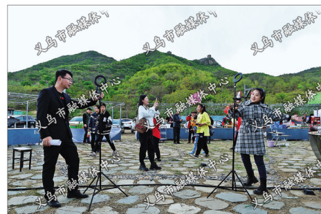
“五一”期间的板厂峪村旅游文化节上,美食主播正现场直播海鲜盛宴。借助近年来的义乌直播经济,作为后裔村的板厂峪在文旅经营理念、直播文娱活动都有了全新变化。