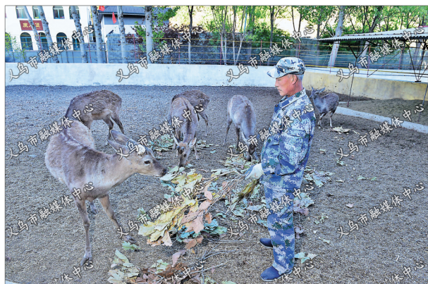
板厂峪村附近的山坳,一位村民正在喂养梅花鹿。经过近几年发展,板厂峪村的现代养殖业成为当地致富路之一。