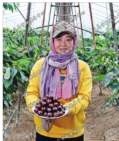
板厂峪村附近的现代农业示范点,村民手捧刚刚采摘的“美早樱”,这里的高品质樱桃销往北京等地。

本报报道策划/组稿:视觉影像工作室 全媒体记者 蒋筱兰