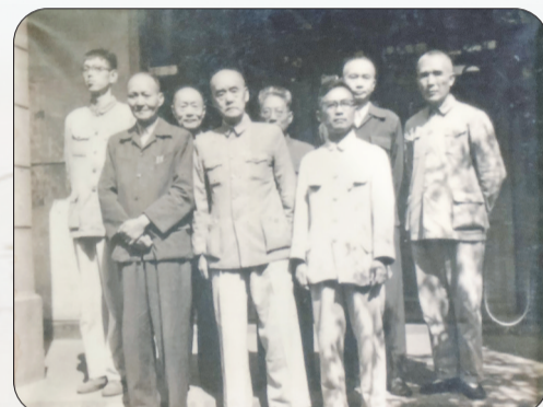
吴山民(前排中)任浙江省政协副主席时与省政协同事合影。