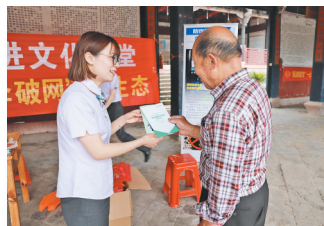
农行义乌分行开展消费者权益保护宣传。