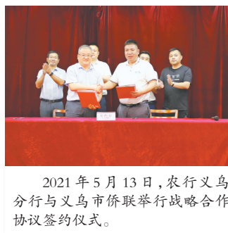
2021年5月13日,农行义乌分行与义乌市侨联举行战略合作协议签约仪式。