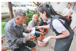
农行义乌分行开展防诈骗宣传。