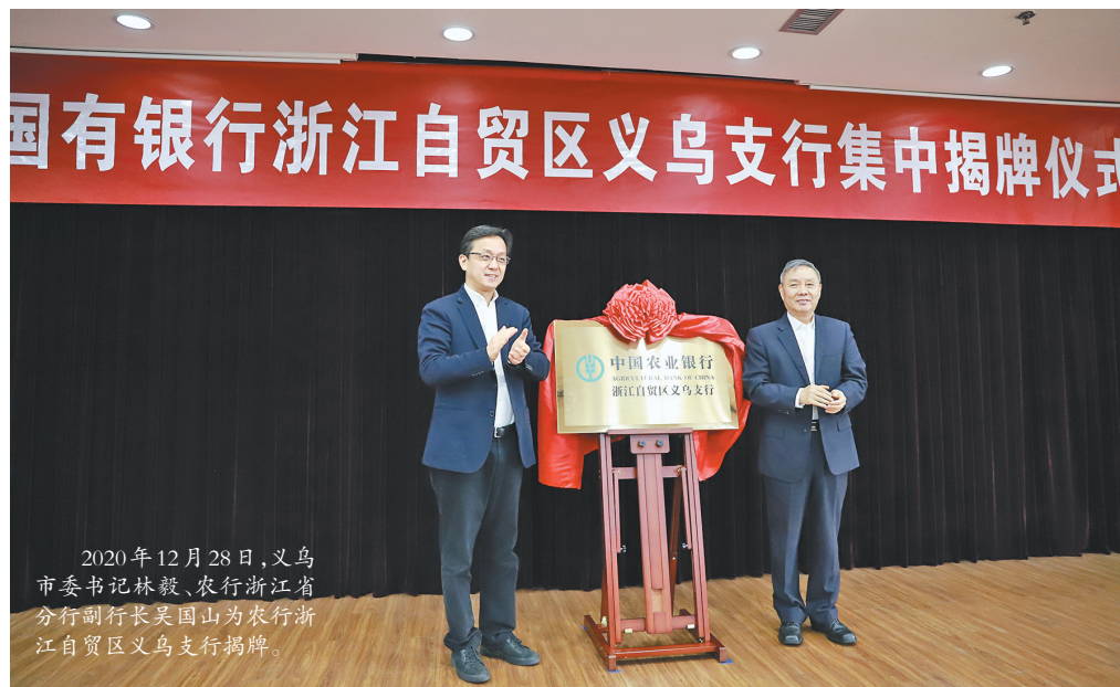
2020年12月28日,义乌市委书记林毅、农行浙江省分行副行长吴国山为农行浙江自贸区义乌支行揭牌。

2019年以来,该行已累计举办惠农服务宣讲活动540余场次,惠及农户9800余人,创建农村金融自治村27个,完成农户建档8.46万户。截至5月末,全行共发放惠农卡20.03万张,涉农贷款余额385.84亿元,投放惠农机具602台,普惠金融领域发放农户贷款91.49亿元,“惠农e贷”余额达到43.05亿元,进一步擦亮了农行服务乡村振兴的品牌。