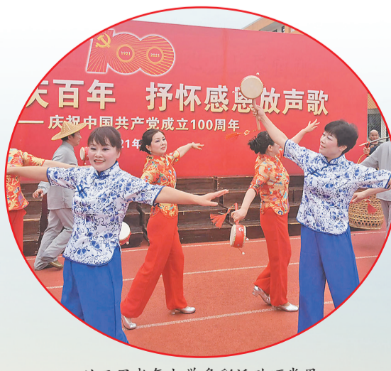
廿三里老年大学多彩活动颂党恩。

“新桥‘颜值’太高了,建成后极大地方便了我们的通行。”7月18日,位于何宅的义东大桥建成通车。这座连接着廿三里街道与东阳市白云街道的大桥,原桥面仅宽7米,影响了交通,限制了交流。接到群众反映后,廿三里街道积极与东阳市白云街道对接,很快敲定了建设方案。党建引领惠民生,凝心聚力办实事。廿三里街道以民生需求为导向、民生实事为抓手,通过智慧党建,不断丰富为民服务内容,提升为民服务质量。