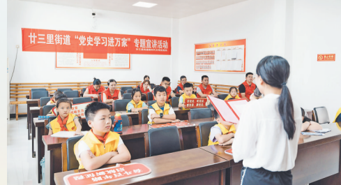
廿三里党史学习教育进万家活动。

“开展党史学习教育,让大家感受到践行初心、使命不是一个口号,而是实实在在的行动。”参加活动的年轻党员纷纷表示,要认真学习党史、践初心,传承和发扬党员先锋模范精神,把为人民服务的优良传统扎在心里,让党史鲜活起来。