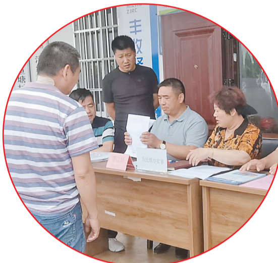
活鱼塘村摆摊设点开门接访民生诉求。