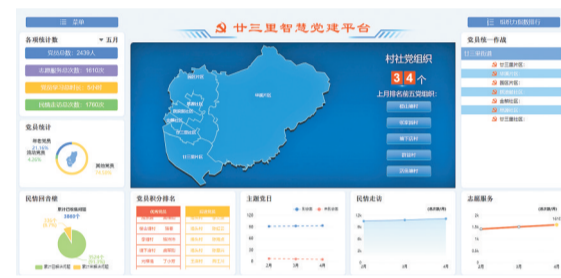
廿三里智慧党建后台操作系统。