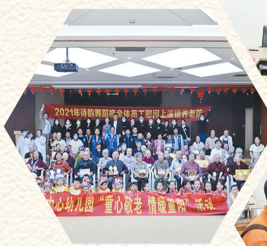
义乌市民政局与长沙民政职业技术学院签订战略合作协议。