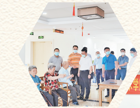
省民政厅领导调研我市养老服务工作。

如何积极应对人口老龄化,提升养老服务质量,让老人安享晚年?自党史学习教育开展以来,市民政局积极开展“我为群众办实事”实践活动,把老年事业发展作为全局为民办事实重点推进项目,围绕增进民生福祉倾注“三心”,将养老服务主动融入区域经济社会发展大格局,不断提高老年人福祉水平。