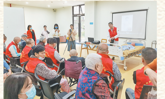
义乌市中医医院为康乐园养老中心的老人们开展了“爱在重阳 医路相伴”医养结合义诊志愿服务。

10月13日,秉承着为老年人送健康的宗旨,义乌市中医医院走进康乐园养老中心,为老人们开展了“爱在重阳 医路相伴”医养结合义诊志愿服务。医护人员现场为老人们提供了中医诊脉、中医特色的养生保健讲座、中医养生茶、心电图检查、血糖血压检查、理发等多样活动,让整个康乐园养老中心暖意浓浓。