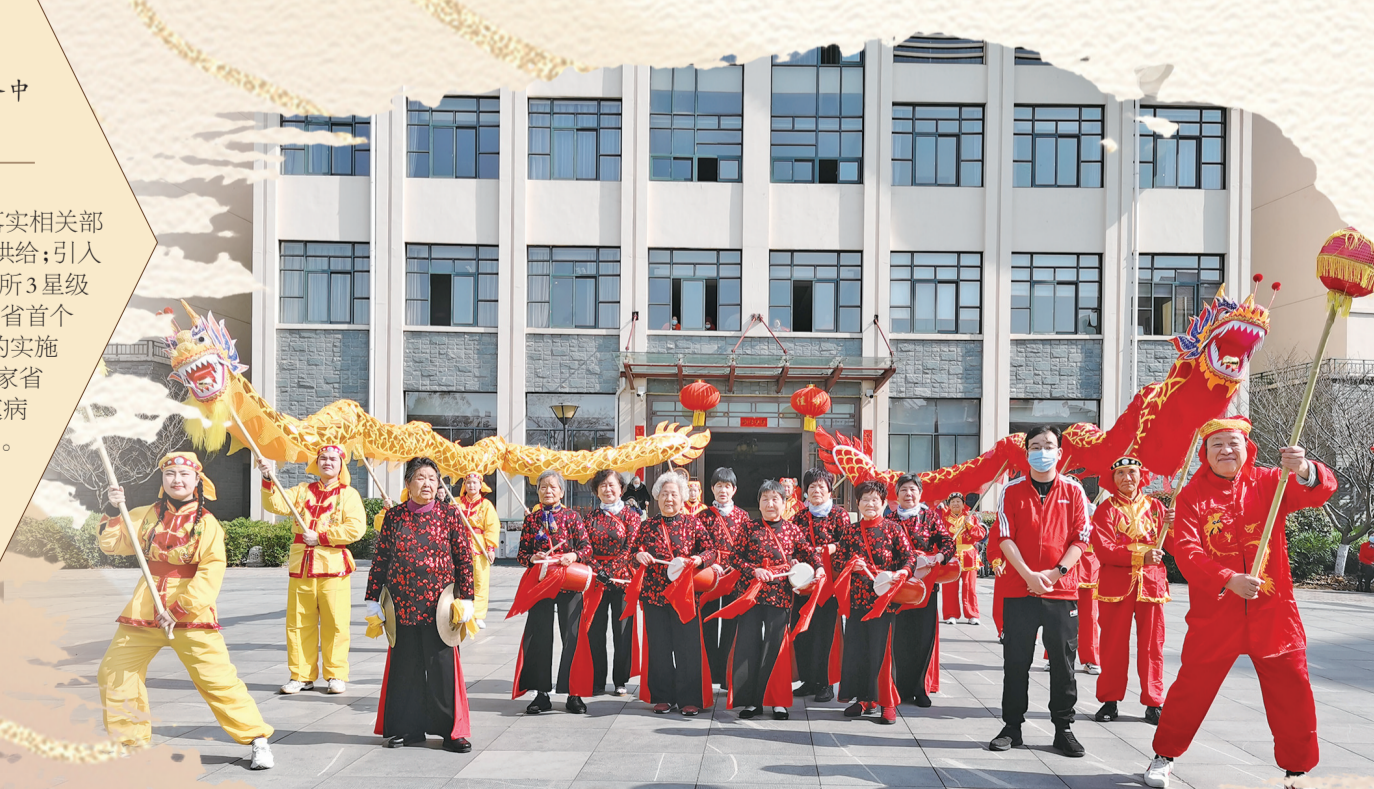
封闭管理期间,怡乐新村组建老人舞龙队。