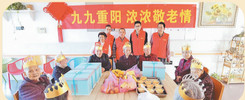
重阳节前夕,北苑残疾人之家的志愿者走进北苑街道养老服务中心,陪伴老人欢度重阳节。

为积极应对人口老龄化,加快发展养老服务,义乌市委市政府认真落实相关部署,完善市镇村三级服务网络,推动普惠养老服务全覆盖、个性服务精准供给;引入专业团队,于全省率先实现机构养老全面社会化,每个镇(街道)都建有一所3星级标准的养老机构;建立健全失能老年人长期照护补助制度,制定出台全省首个长期护理保险系列地方标准;于全省率先发布推进医养结合发展工作的实施意见,实现全市老年人家庭医生签约全覆盖;大力推进怡乐新村等2家省级康养联合体建设,为老人建立健康档案,提供康养服务;建立家庭病床206张,打造养老、医疗、康复、护理、临终关怀一体化服务体系。“医、康、护”三位一体的健康养老模式入选“全国医养结合典型经验”,市养老服务指导中心被评为全国敬老文明号。截至目前全市共有养老机构11家,养老床位6818张,每千名老人拥有机构养老床位40.9张;建成示范型居家养老服务中心14家,社区居家养老服务照料中心(站)490家。以居家为基础、社区为依托、机构为支撑、医养相结合的养老服务体系基本建成。