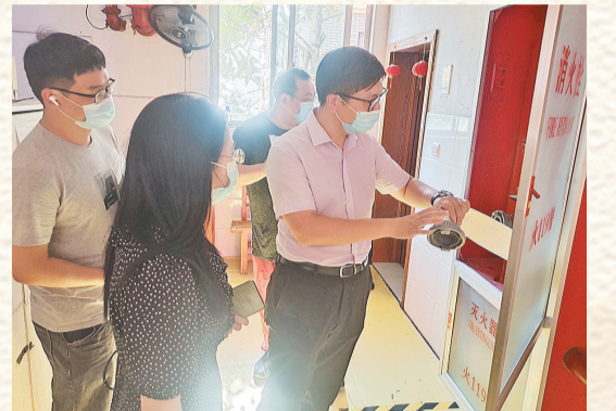
养老机构消防安全检查。

为树立养老护理行业模范典型,营造争先提标的良好氛围,发挥其示范引领作用,接下来,市民政局还将开展2021年“最美养老护理员”和“十佳居家养老服务照料中心”评选,树立养老护理行业模范典型,营造争先提标的良好氛围。