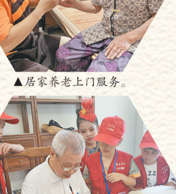
居家养老上门服务。