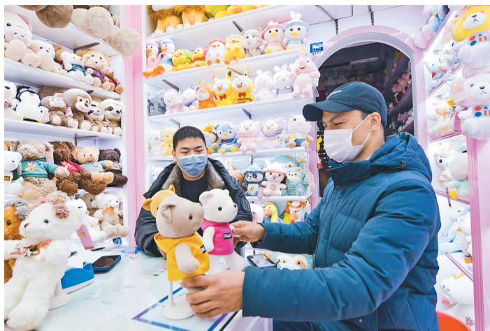
常驻义乌外商毕需正与经营户洽谈生意。