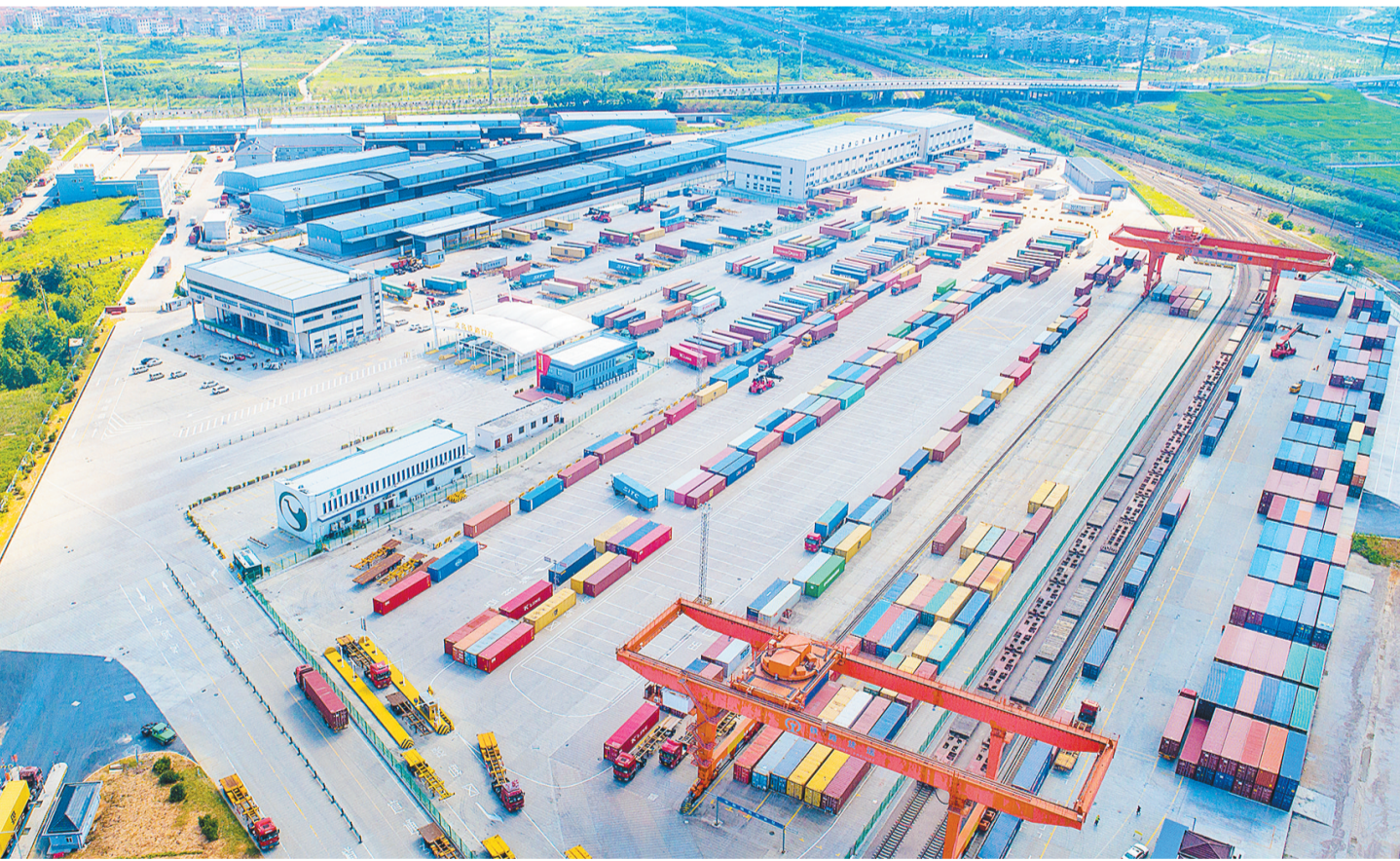
繁忙的义乌铁路口岸。