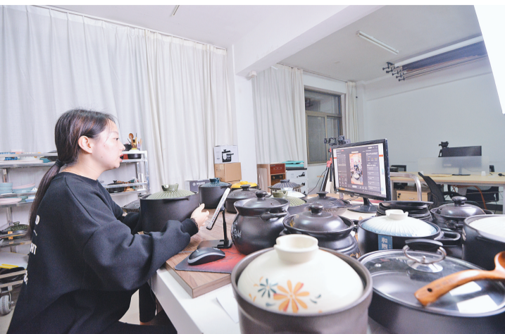
义乌电商正在直播卖货。