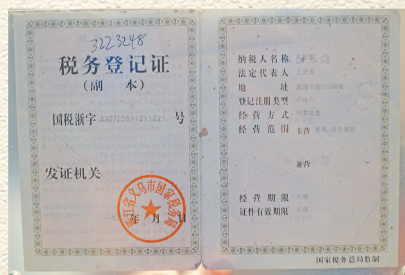
20世纪90年代义乌市国家税务局颁发的税务登记证。