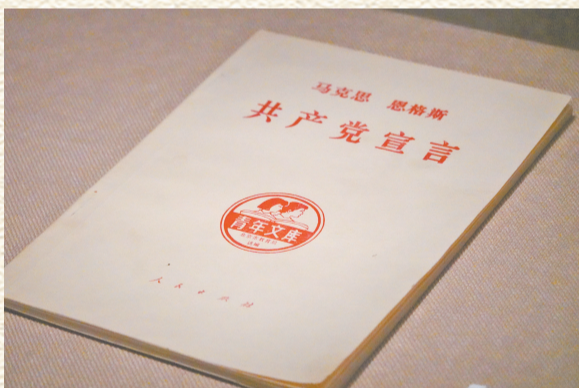
人民出版社出版的《共产党宣言》。