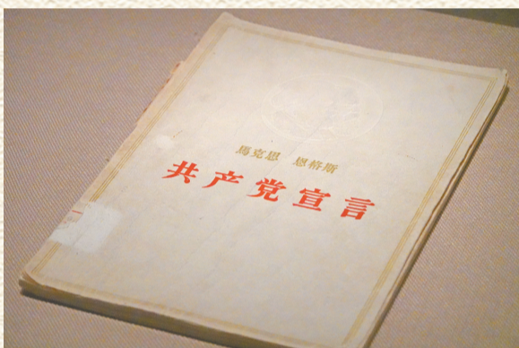
展示柜里的《共产党宣言》。