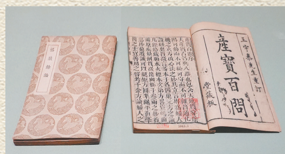
朱丹溪编撰的《产宝百问》与《格致余论》。