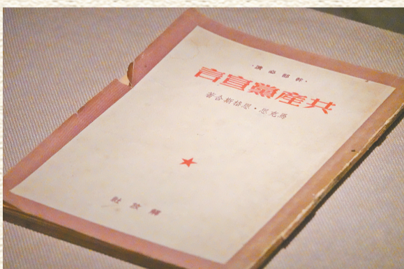
解放社出版的《共产党宣言》。