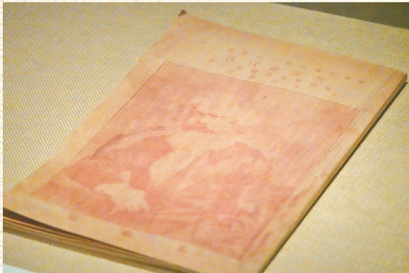
陈望道译第一版《共产党宣言》(仿制品)。