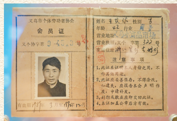
义乌市个体劳动者协会会员证。