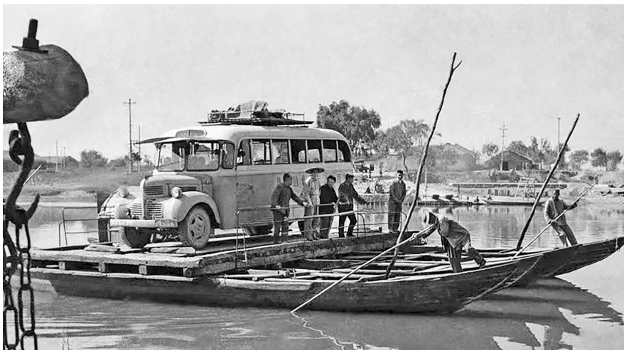
《佛堂汽车轮渡》,摄于1974年。