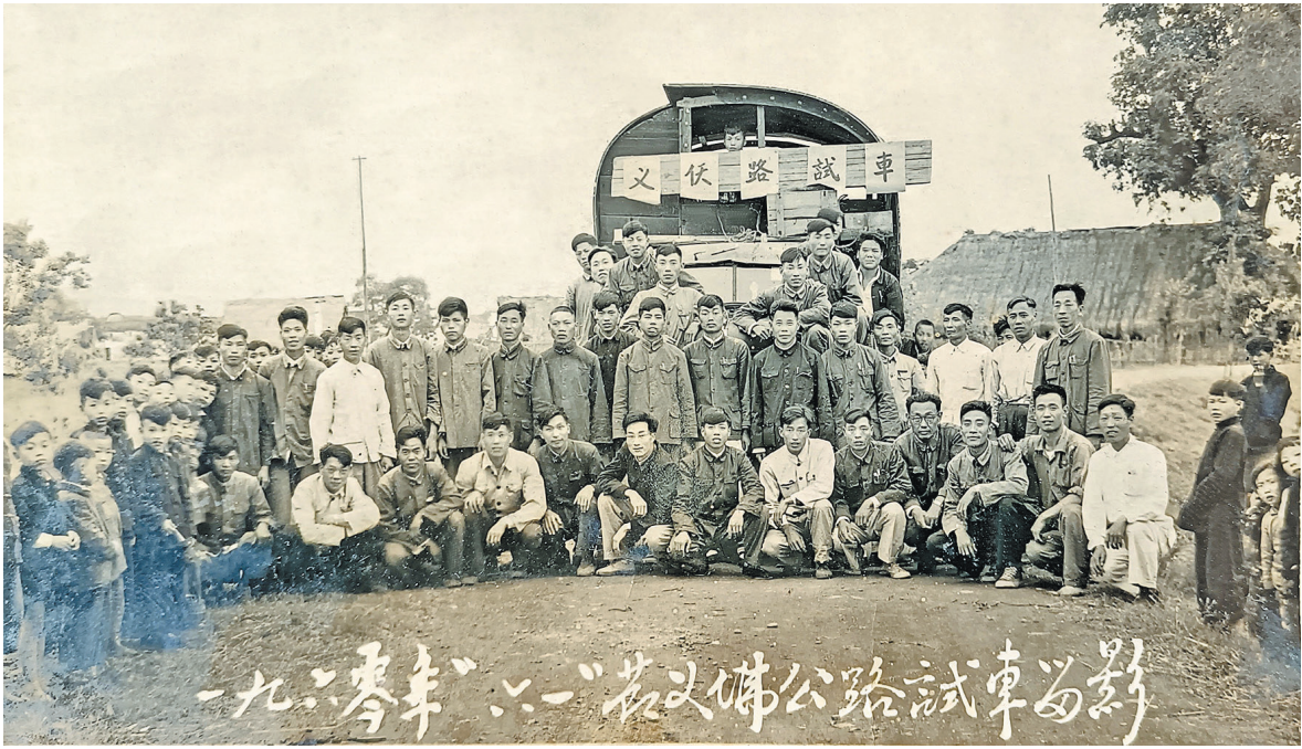
《义佛公路试车》,摄于1960年。