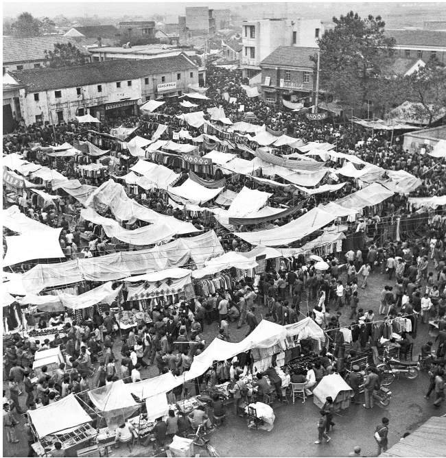
《新市基·佛堂十月十》,摄于1987年。