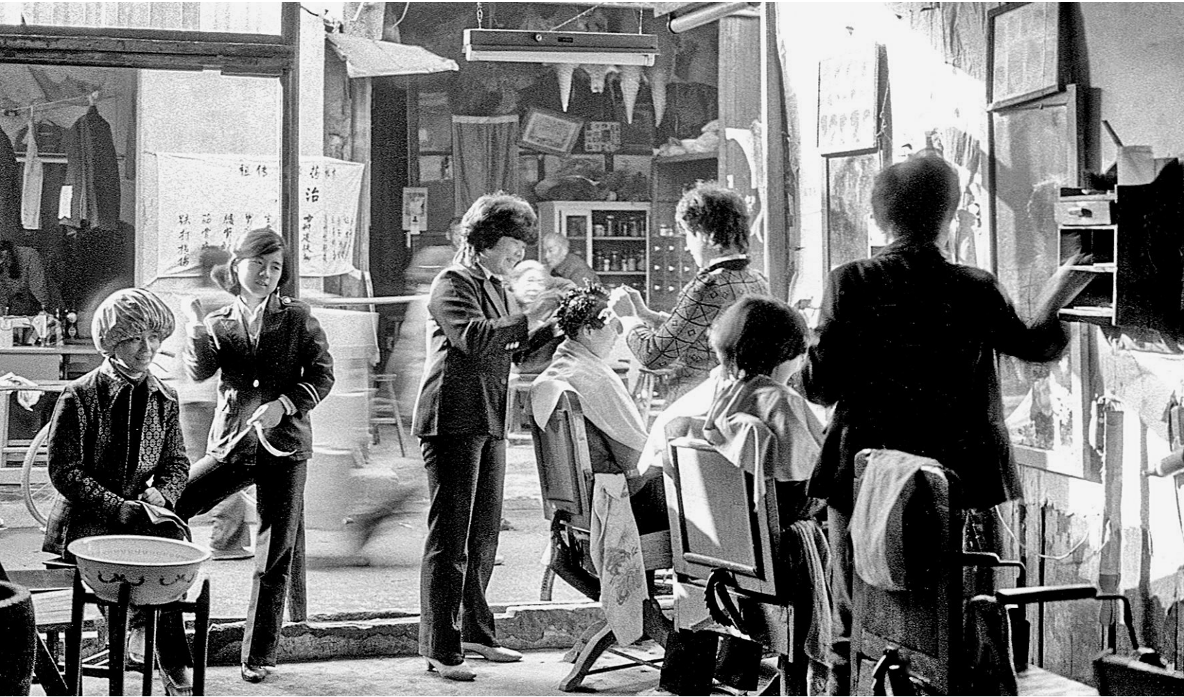
《老街理发店》,摄于1987年。