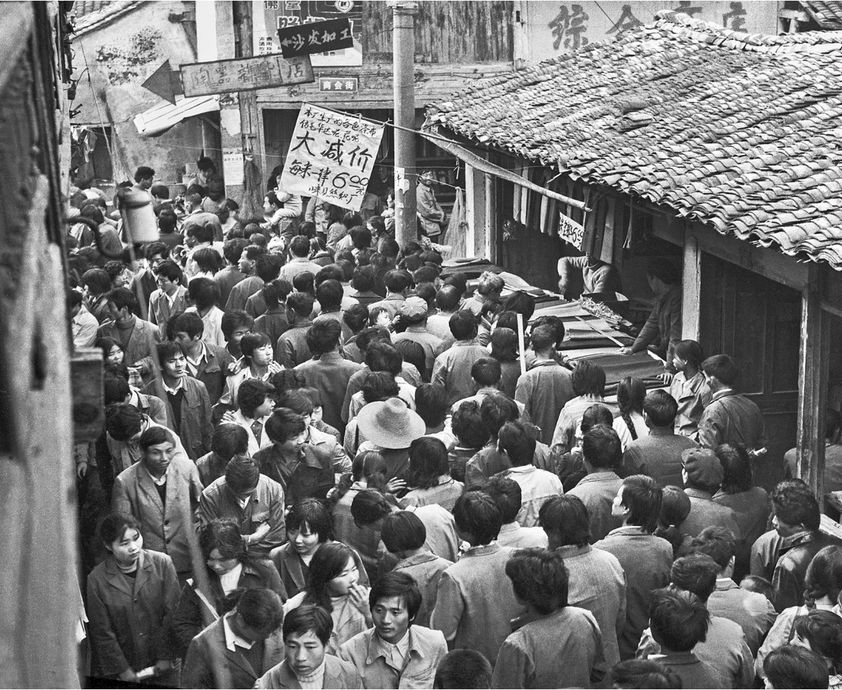
《佛堂老街·佛堂十月十》,摄于1978年。